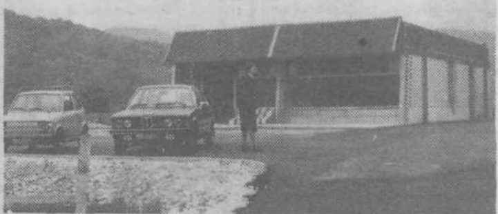
V Senožetih je trgovina Mercator-tozd Golovec že pod streho. Vaščani upajo, da bodo kmalu lahko tudi kupovali v njej. AM