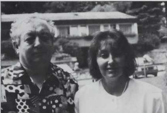
Lejpe rauže, kratko korenjé