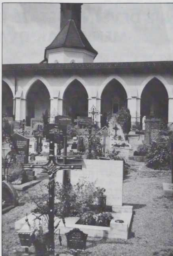
Te cintor je nej za tihince