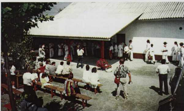
SPOZNAJMO SE, letos prvič v goričkih Budincih, najsevernejšem naselju v Sloveniji

Gostom so pokazali gojitveno lovišče Kompas v Peskovcih, semenamo Pannonka na Hodošu, mejni prehod Hodoš-Bajánsenye in cerkev Svetega Nikolaja v Dolencih. Ob tej priložnosti je bila tudi začasno odprta meja med Andovci in Budinci.