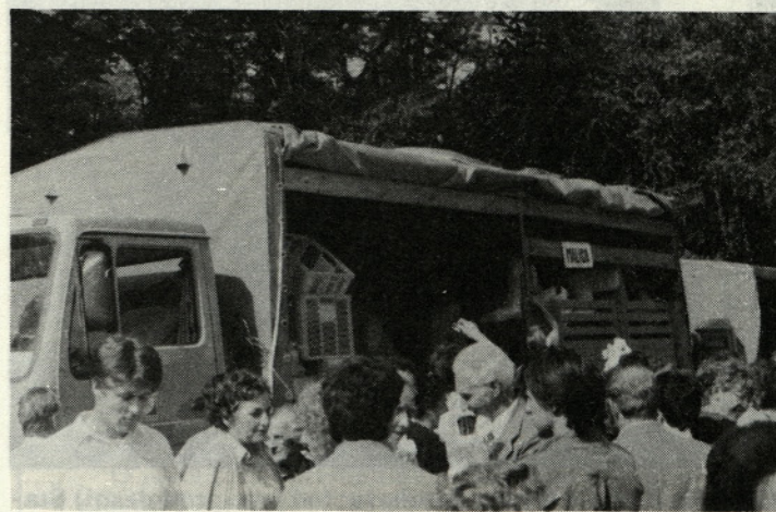
Takole pa so gostinci uredili priročne bifeje, kjer so udeležencem delili malico