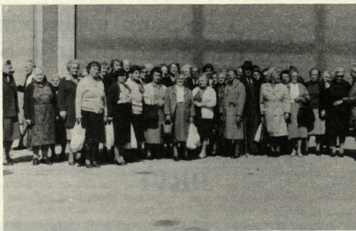
Takole skupaj pa so se našli tudi še živeči udeleženci velike tekstilne stavke