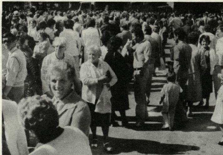
Srečanje s sodelavci, prijatelji, stiski rok — vse to je bilo prisotno 20. septembra na srečanju tekstilnih delavcev Gorenjske