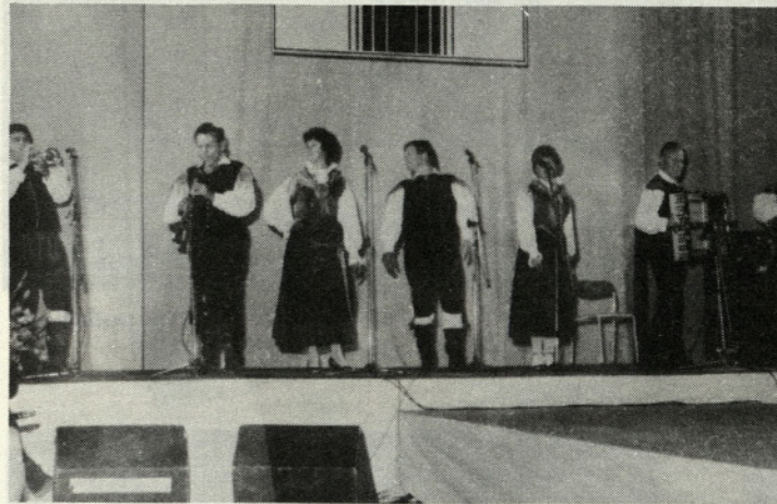
Ansambel bratov Avsenik med nastopom