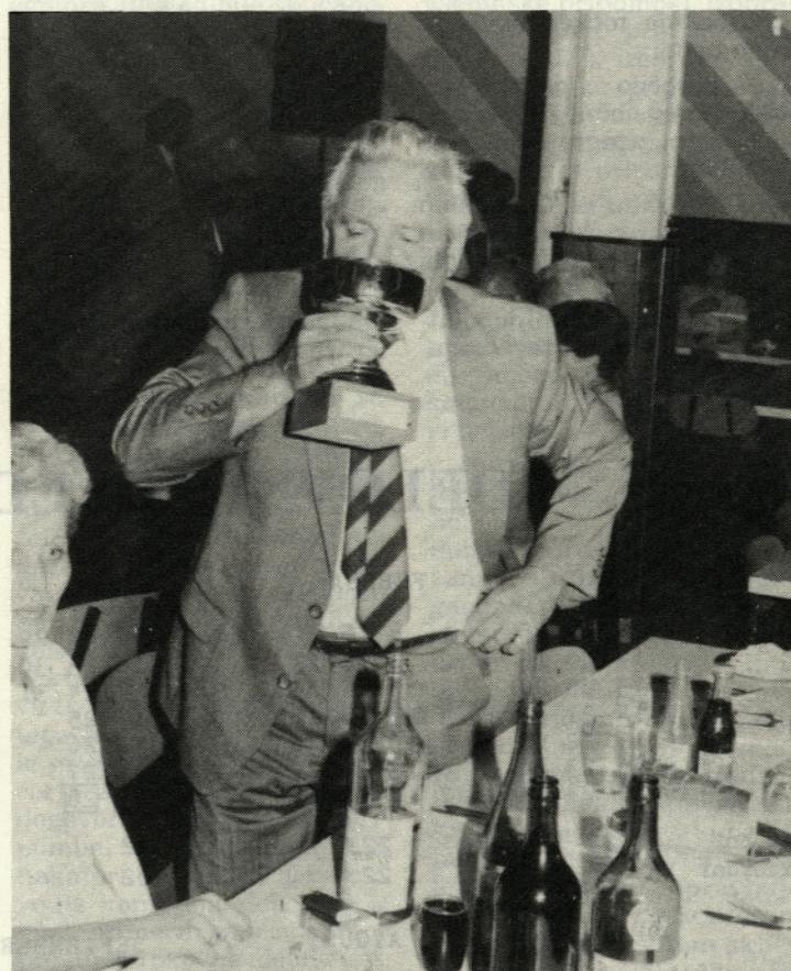
Zaslužni pokal prvakinj v predenju bombaža je bil po podelitvi takoj krščen