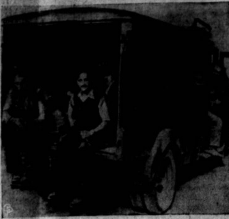
FRENCH MAQUIS of the French Forces of the Interior, armed with guns supplied by the Allies, are shown on a truck as they set out to hunt stray Nazis near Argentan, France. About 50,000 of these FFI men liberated Paris after four days of street fighting. Note the Cross of Lorraine on the truck.

Najlepše se je dalo pogovar- jati pozimi, na veliki, topli pe- či. Zunaj je bila noč in mraz je škripal skozi okna, izba pa je bila polna sladkih pravljic, ki so nam šepetale na uho še tišje in milejše od samih naših besed. Pa smo tudi vsi molčali, pa da se niti spogledali nismo, razumeli bi se bili vse do kraja. Bilo je, kakor skupna molitev in kakor skupna pesem: če nas je sedem ali sedemdeset—molitev je ena in ena je prošnja, pesem ena in en sam je Bog. Nikoli si nismo bili tako blizu, tako bratje in sestre, kakor ob tistih svetih urah. Sredi med nami je sedel sam angel božji ter nam je pripovedoval o lepotah iz paradiza; nam pa se je zdelo, da govore naše plahe ustnice.