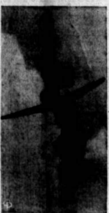
AS HE PLANE burtles on without him, a Luftwaffe fighter pilot tum- bles earthward, his parachute not yet opened, after his ME 109 plane was attacked by a U. S. 8th Air Force pilot somewhere over France.

so jakali na glas, brez solz, ka- kor troje mladih živali. Čemu da so jokali, vedi sam Bog ne- beški.