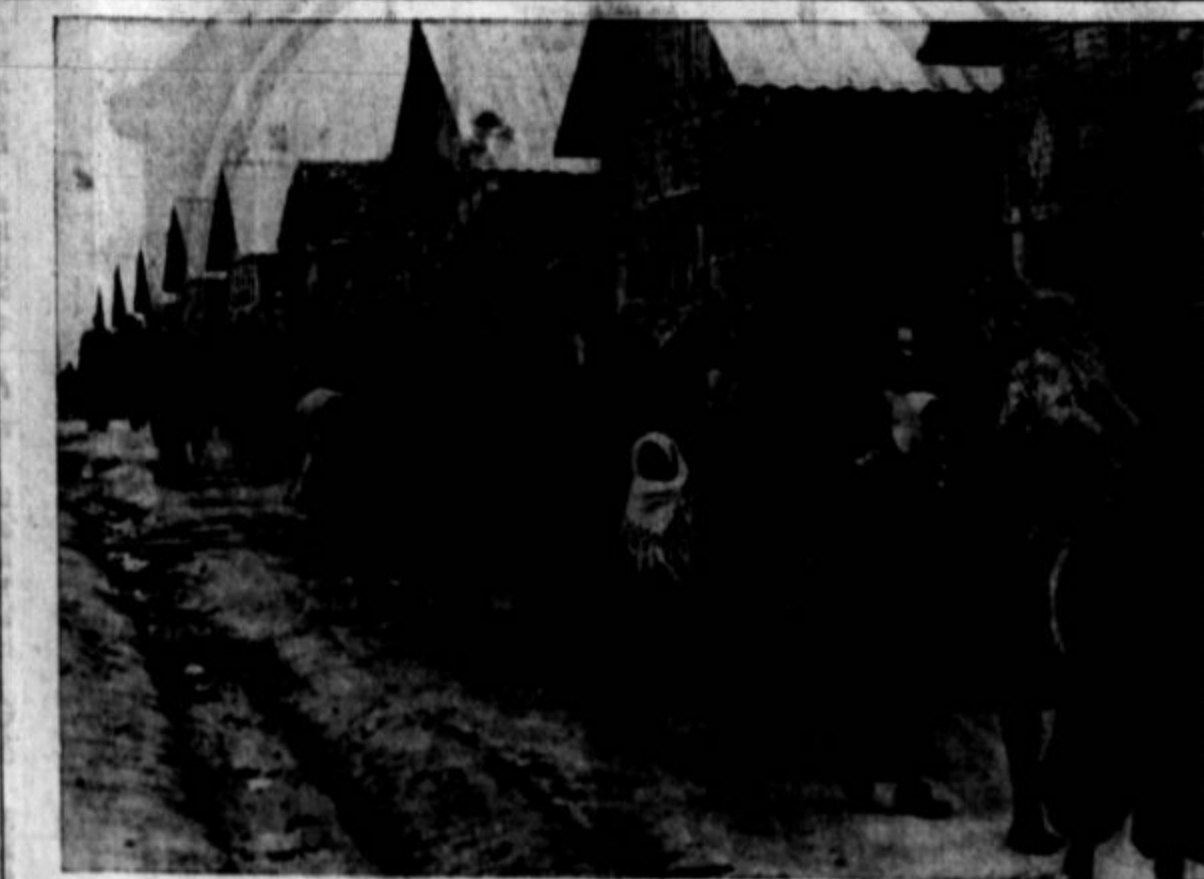
Priser iz vojnega taborišča "nekje v severni Afriki," kjer je naseljenih veliko število vojnih beguncev iz centralne in vzhodne Evrope. V teh taboriščih je tudi tisoče jugoslovanskih vojnih beguncev in pobeglicev. Ta taborišča pomagajo vzdrževati razne, po vladi priznane religiozne organizacije, ki dobe del svojih sredstev iz vojnega religiozne fonda, ki se zbira zdaj širom Amerike pod lokalno označbo "community chest." Iz tega sklada bo tudi jugoslovanski relief dobil svoj delež. Kvota za čikaško okolico—okraj Cook, Lake in Du Page—je $12,980,000. Kampanja za zbiranje tega sklada se je pričela 2. okt.

Značilno so Churchillove besede, da je Amerika "graciozno sprejela ponudeno ji" angleško bojno mornarico. Tisti njegov stavek se čita kot da je Anglija napravila s tem generozno uslugo Ameriki. Brutalno dejstvo pa je, da se Amerika težko irtuje za rešitev angleškega, holandskega in francoskega imperija v Aziji. Ampak to je drugo vprašanje.