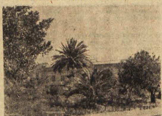
Nabrežje, ki slovi za najlepše v Italiji: Lungomare v Reggio Calabria

Ne bi žrtvoval skopo odmerjenih vrstic za ponavljanje teh znanih stvari, če ne bi tudi o naši bližnji zahodni sosedbi bral popotne utrinke, iz katerih sem (na) navedem le ta primer) slednjije izluščil, da je sicer v Rimu nekaj občudovanja vredne antike, da ne ponavljam vsega