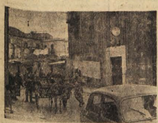
Dva svetova v Neaplju