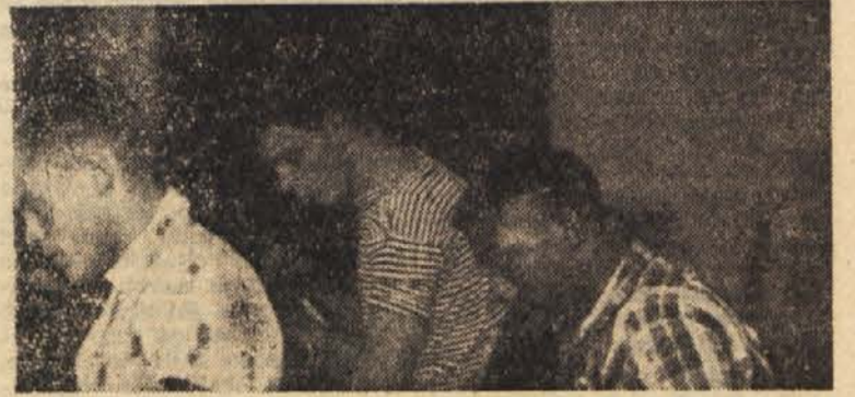
Črni in beli študentje složno v skupnih prostorih na neki visoki šoli v Texasu

Predsednik republiškega ministrskega sveta Jasnov je poročal o letošnjem družbenem planu, finančni minister pa o proračunu. Popoldne je bila razprava o obeh osnutkih. J. P.