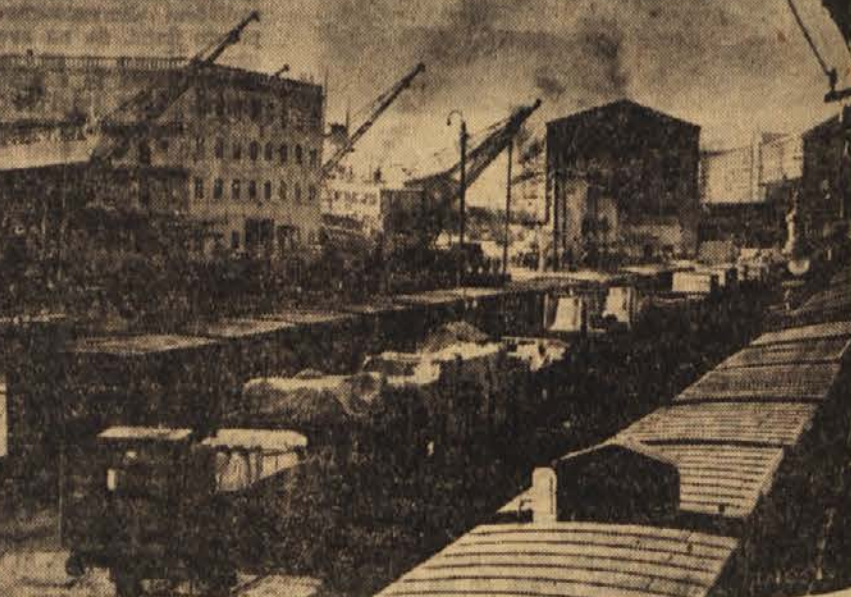
Iz Litostroja so pred kratkim odpremili na Reko prvi del opreme za hidrocentralo Chichoki Malian v Pakistanu (pokrajina Lahore). Centrala bo imela tri agregate po 6500 kW. Na sliki je prvi del vlaka s prvim delom opreme (18 vagonov) v reški luki