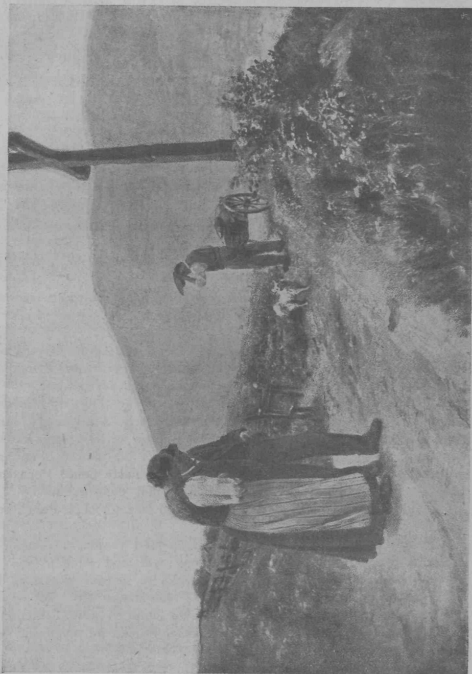
Zadnje besede na prelazu.