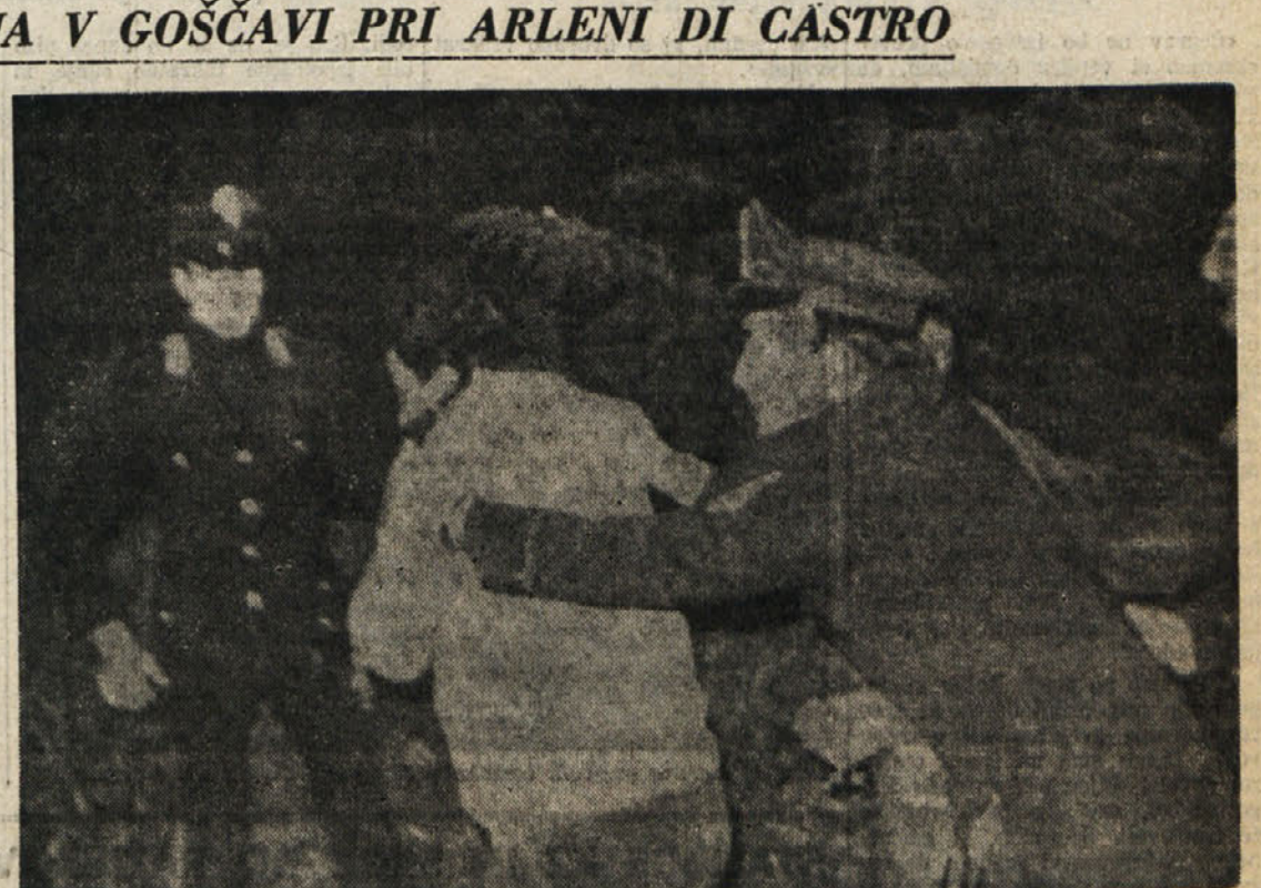
Aretirani terorist prime linee pred karabinjersko vojašnico v Tuscani

«Kar me najbolj žalosti, je dejstvo, da nekateri intelektualci ne rabijo sredstev, s katerimi razpolagajo za širjenje pameti in kritične zavesti, temveč se udnjajo «čarovanj-kom» pri njihovih magičnih obredih. Dokler bo politika magija, je jasno, da se intelek-tualec, ki se posevem istoveti s politično ob-lastjo, pa četudi manjšinsko ali nasprotno spodujoči oblasti, odpoveduje svoji vlogi. Se slabše je, če priznava vlogo tistega, ki pri-pravlja in ostri orožje, s katerim se magija izvaja. Namesto da bi navajal ljudi na kri-