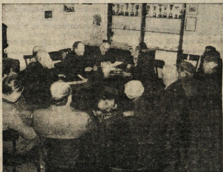
Z občnega zbora Zavarovalnice za govejo živino v Bazovici

Pravilnik natečaja je razobešen na oglasnih deskah občin članic (Doberdob, Devin-Nabrežina, Foljan, Tržič, Repentabor, Ronke, Zagraj, Dolina, Sovodnje, Zgonik in Trst) in Kraške gorske skupnosti v Sesljanu štev. 56/B (tel. 299-026) od 8. do 14. ure.