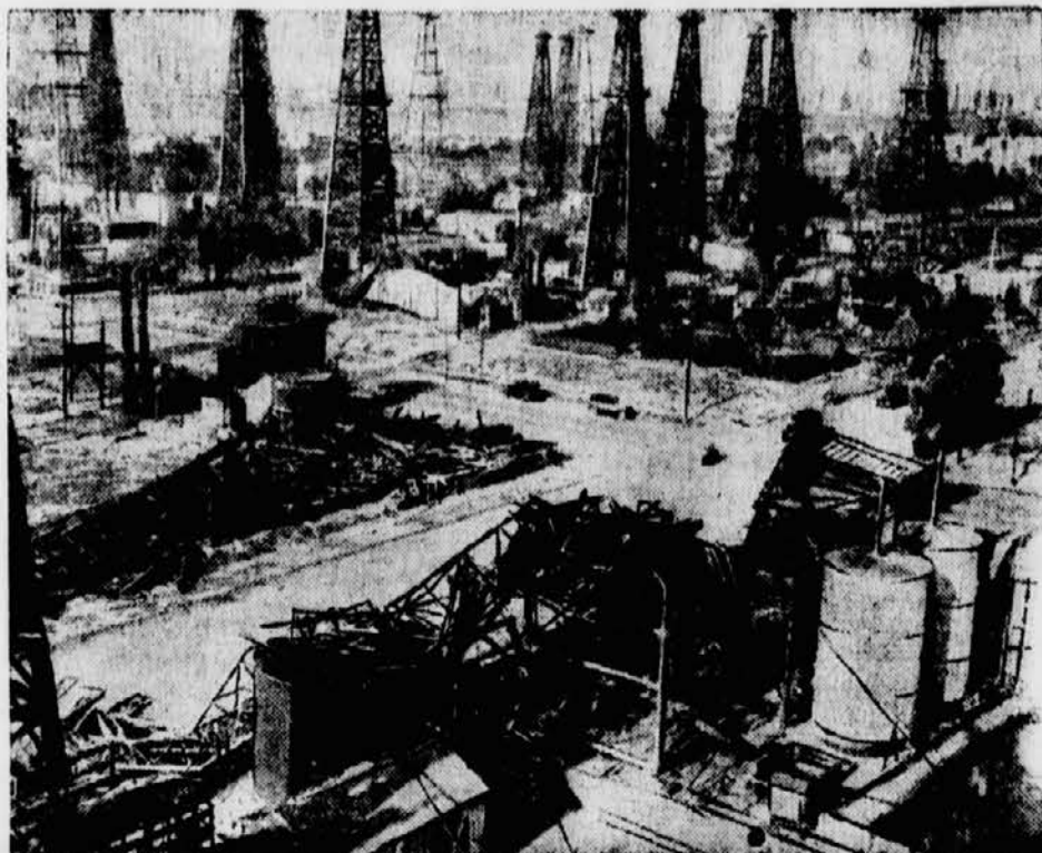
Südifornien wurde kürzlich von einem schweren Wirbelsturm heimgesucht, der auch etnige Todesopfer forderte. Eine Vorhersage von der Gewalt des Unwetters kann man sich aus unserem Bild machen: wie man sieht sind mehrere große Ölbohrtürme in Huntington bei Los Angeles vollkommen zerstört.