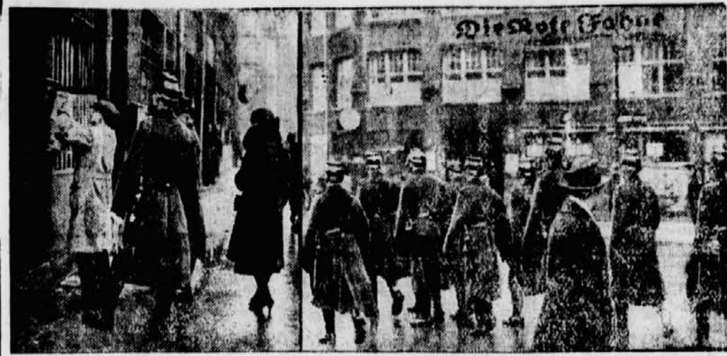
Das Karl Lieblnecht-Haus am Bülow-Platz in Berlin, die Zentrale der kommunistischen Partei Deutschlands, ist von Polizei- und Kriminalbeamten besetzt und durchsucht worden. Unsere Bilder zeigen (links) die Beschlagnahme eines Exemplars der Roten Fahne, (rechts) eine Schupoabteilung bei der Absperrung des Platzes.