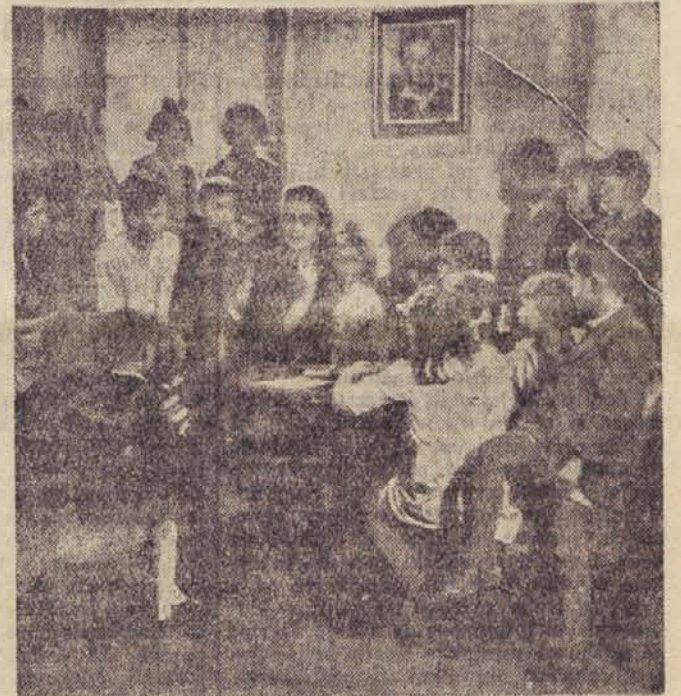
Cicibanov kotiček na Prulah

»Čudo, prečudno! Res pojejo meni! Ciciban, Ciciban! ališim ves čas, drobno kot pličke na veji zeleni: Ciciban, tebi zlat kujemo čas!«