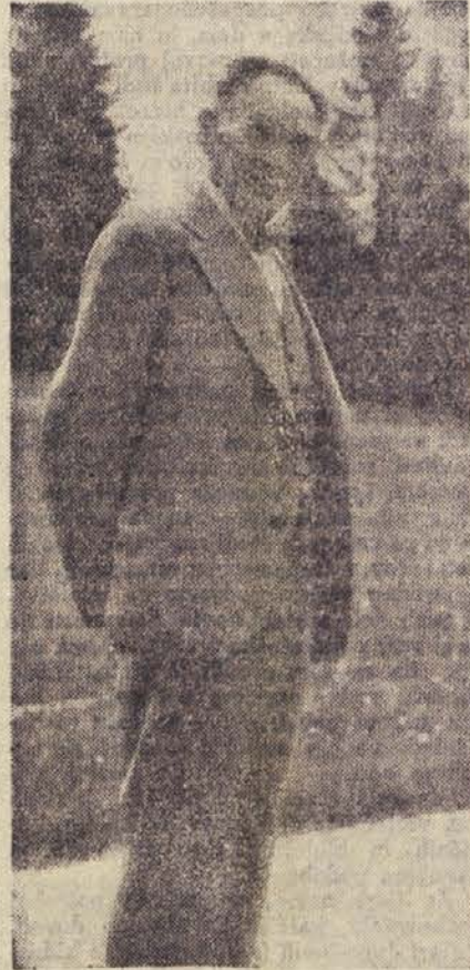
Oton Župančič na Bledu l. 1938

Cankarjeva založba, založnica dopolnilnega zvezka k Delom, se je potrudila, da bo knjiga glede na zunanjo in notranjo opremo posneta natanko po predvojni izdaji. Tako bo novi Župančičev zvezek zaključil zbirko in bo s prejšnjimi zvezki vred nudil zaokroženo podobo bogate pesnikove stvaritve. Seveda je naloga našega založništva, da čimprej oskrbi kritično izdajo celotnega Župančičevega opusa. Knjiga, ki se pridružuje kot peti zvezek k Delom, obsega v glavnem Zimzelen pod snegom in Veš, poet, svoj dolg? Razdeljena je v dva dela: pesniški in prozni. V prvem delu sledi celotnemu Zimzelenu pod snegom skupina pesmi z naslovom Zadnje pesmi, ki so vzete bodisi iz knjige Veš, poet, svoj dolg?, bodisi iz revije. Prozni del obravnava razdelitev v dve skupini, kakor jo ima knjiga Veš, poet, svoj dolg?, z naslovoma Kultura in novi čas in Politični govori in članki. Prva skupina je pomnomena s sedmimi proznimi sestavki. Med