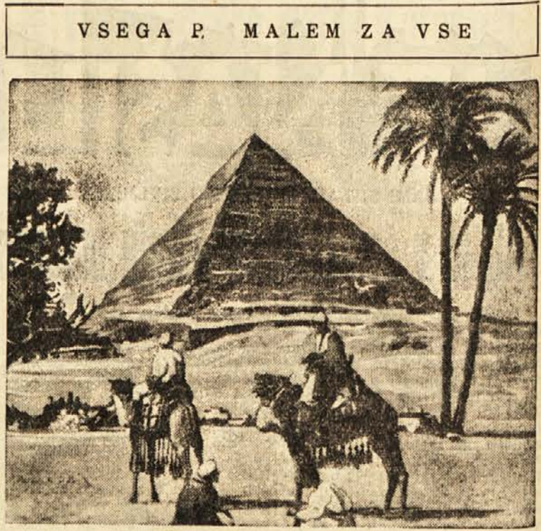
Piramida pri vasi Gizeh v Egiptu