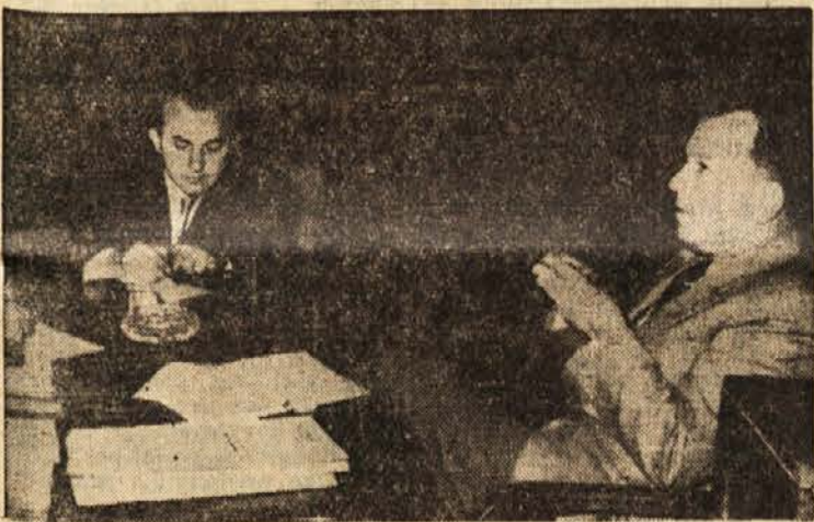
Tovariš Vukmanović v razgovoru s sodelavcem »Borbe«

Od stare Jugoslavije smo po- dedovali zelo nerazvito metalur-