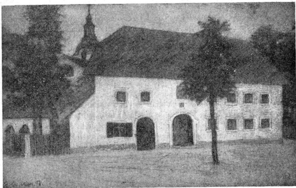
Krekov dom v Selcih.