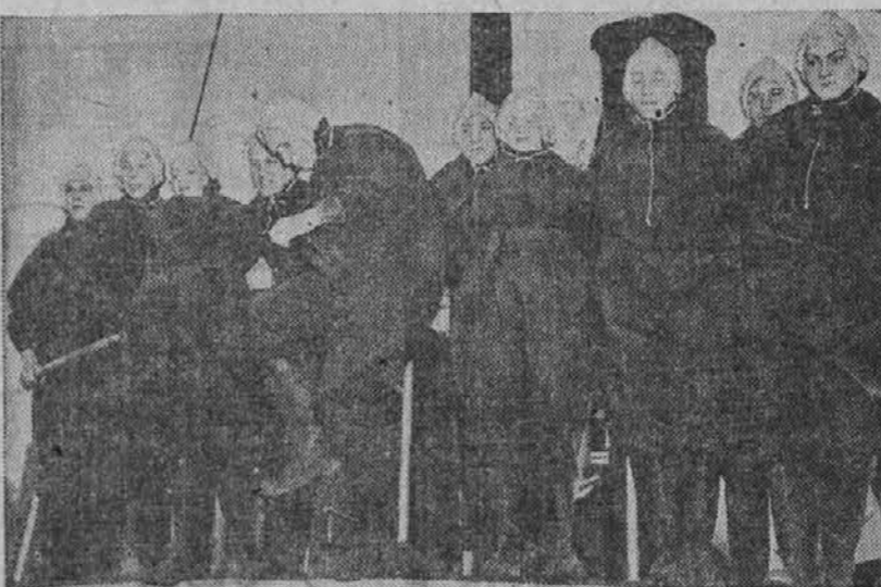
Na sliki vidimo skupino norveških mladenk in mornarjev, ki so oblečeni v nove vrste obleke, s katero se morejo dolgo časa ozdržati na vodi. Ko se obleko obleče in zaveže okoli vratu, se jo napihne z zrakom, ki drži človeka dolgo varno na vodi. Slika je bila vzeta v newjorskem pristanišču.