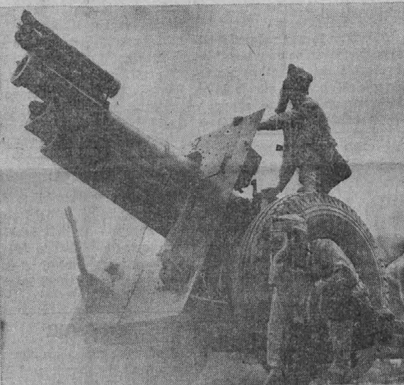
Na sliki vidimo 155-milimetrski možnar ameriške armade, ki dela ž njim prve poskuse v streljanju tekom vojaških vaj v Camp Forrestu v Tenn. Ta možnar nosi 95 funtov težke izstrelke 12,800 jardov daleč.