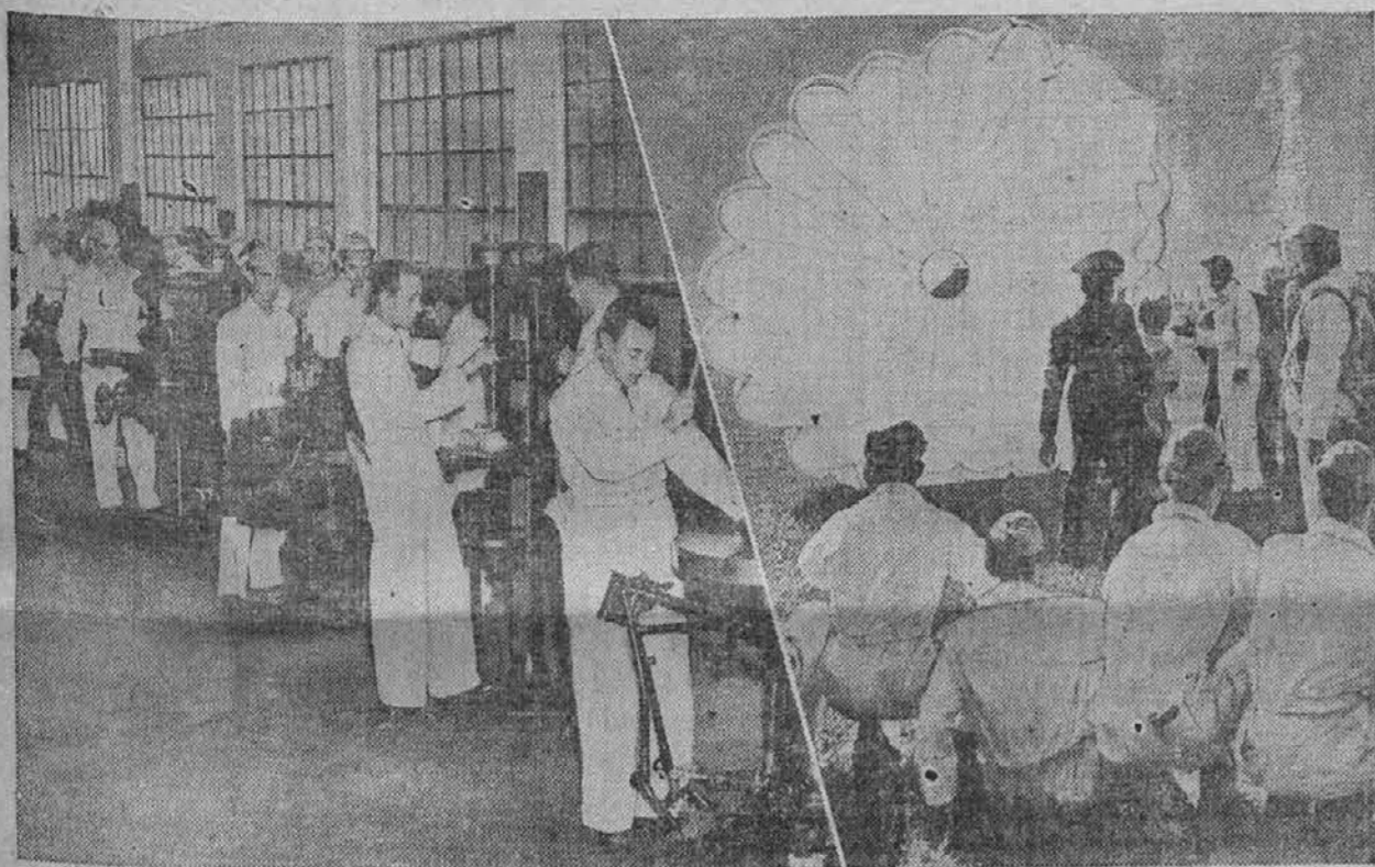
Tudi v republiki Kubi se pripravljajo na vse eventualne možnosti, med njimi tudi na zračne napade. Na levi se trenirajo mladeniči v letalski mehaniki, na desni pa se uče pravih odskokov z letala s padalom. Sedeči mladeniči v ospredju poslušajo instruktorja, ki jim razlaga, kako se pravilno odskoči z letala.