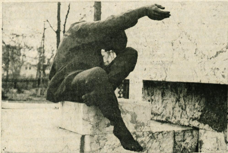
DOMŽALE: Detajl spomenika padlim za svobodo

Jugoslovanski narodi so največji korak v razrešitvi tega vprašanja storili v narodnoosvobodilnem boju, ko so hkrati s skupno vstajo zoper okupatorje in domače izdajalce izrazili tudi voljo in hotenje, da ostanejo trdno povezani v skupni državi. Posamezni narodi so že od prvih začetkov oboroženega boja revolucionarno gradili svojo lastno državnost pod vidikom prostovoljne in enakopravne združitve v skupno tvorbo, hkrati pa so pod enotnim vojaškim in političnim vodstvom v boju krepili vezi med narodi in narodnostmi. V prelomnem obdobju druge svetovne vojne so predstavniki vseh jugoslovanskih narodov 29. novembra 1943 na II. zasedanju AVNOJ soglasno sklenili zgraditi novo Jugoslavijo na demokratičnem in federativnem načelu kot državno skupnost enakopravnih narodov. Že odloki AVNOJ pa so bili hkrati v bistvu tudi zavarovanje pre-