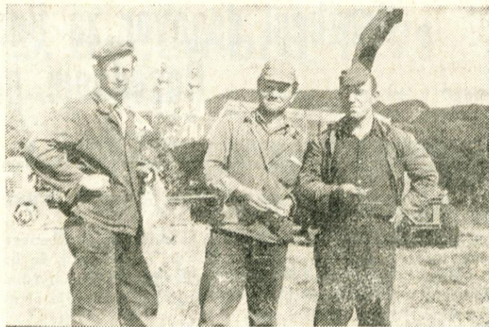
Delavci strojne postaje EMONA so na kombinatovem travniku v Moravčah kosili sejano travo za siliranje, kajti letos so tam postavili nove vrste silosov s plastično oblogo.