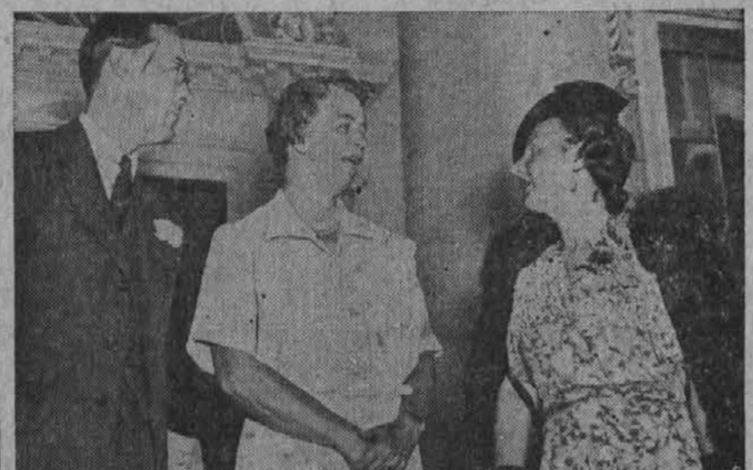
Ko sta se nedavno holandska princesa Julijana in njen mož Bernhard nahajala v Zedinjenih državah, kamor sta prišla iz Kanade, sta bila tudi gosta Bele hiše. Na sliki ju vidimo v pogovoru z Mrs. Rooseveltovo.

Tvoj glas je tako tožen, takoučenik: "Pozdravljeni, zakletnik! Zatekli smo se pod vašo varstvo. Že od jutra vas iščemo in smo vas našli. Pregnani smo iz učilnice!" Zakletnikom se zmračijo čela po zadnjih besedah. Vsi umolknejo in povesijo glave. "Da, iz učilnice so nas pregnali," povzamejo dečki po mučnem premolku. "Prihrumeli so surovi možje in pretepli gospoda učitelja in ga izpehali iz hiše. Nam so ponujali šibo v poljub, surovo so vpili na nas v nerazumljivem jeziku, pačili se nam, a nekdo nam je rekel v našem jeziku, da bo zdaj on naš učitelj, ki nas bo učil drugega jezika, ki je gosposki in lep. Učil nas je kleti mater in nas silil, izgovarjati, da je naša mati ničvredna. Tega nismo mogli izreči in smo jokali. Pa so nas pričeli šibati in so nas tepli tako dolgo, da smo zbežali."