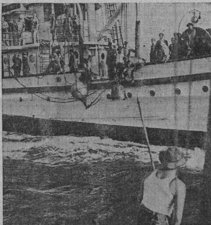
Na sliki vidimo prizor polaganja min v newyorškem pristanišču. Po minah ni seveda še nobene potrebe, ker ni še nevarnosti, da bi bil New York napaden, temveč je to le večja za slučaj potrebe.