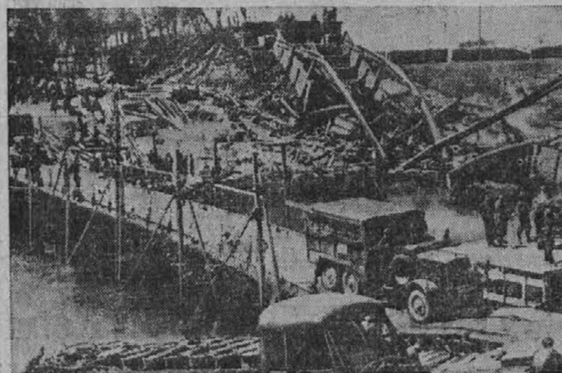
Nacijskih kolon ne ustavi nobena zapreka na njihovem pohodu. Na sliki vidimo zasilen most, ki so ga postavili Nemci preko neke ruske reke, ko so Rusi podrlj prvoten most.