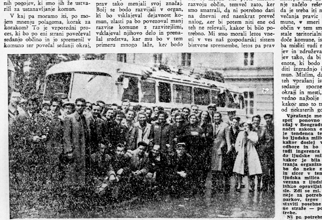
Delegati, ki so pred desetimi leti zastopali mladino Slovenije na II. kongresu USAOJ, so večeraj odpravljali iz Ljubljane v Drvar po približno isti poti kot pred 10 leti. Samo da tokrat po cestah in s avtobusi...