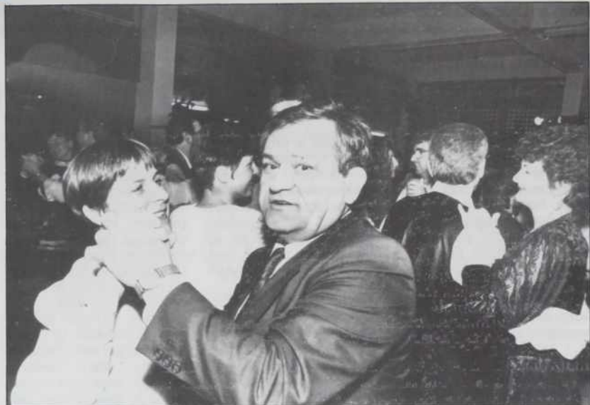
Plesišče je bilau cejlo nauč puno

in Solidarnost iz M. Sobote, Kompas in Radgonske gorice iz G. Radgone, Mlekopromet in Krka iz Ljutomera, Radenska, Ilirija-Vedrog iz Lendave, Pletilstvo iz Prosenjakovcev, VEND-