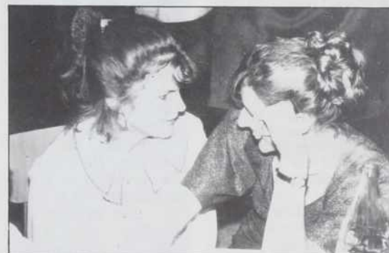
... pa eške mlajše