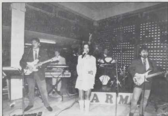
Ansambel ŠARM iz M. Sobote