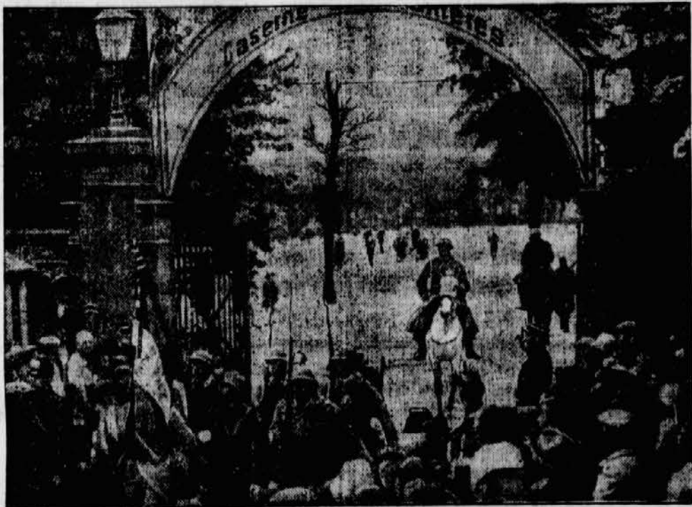
das jetzt ebenfalls von der Besatzung geräumt worden ist.