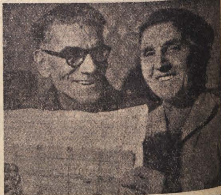
Natanko 44 let sta živila v družinski skupnosti angleška zakonca Cobb. Šest otrok inata in sedem vnukov. Pred kratkim sta vložila prošnjo za potni list in izvedela, da na matičnem uradu sploh nista bila vpisana. Takratni vaški duhoven je pozabil poslati njune podatke na občinski urad. Tako sta bila na stara leta še enkrat ženita in nevesta. To pot sta dobila poročni list

Izhod iz položaja, v katerega so prišle posamezne dežele spričo naraščanja potrošnje alkoholnih pijač, ni le v boju antialkoholikov, marveč v večji proizvodnji brezalkoholnih pijač in v široki zdravstveni akciji, ki naj bi državljanse seznanila s škodljivimi posledicami alkohola, je rečeno v brošuri Svetovne zdravstvene organizacije.