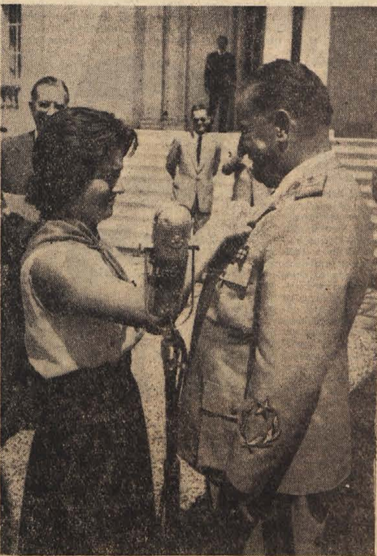
Minuli ponedeljek so predsedniku Titu ob njegovem rojstnem dnevu čestitali naši najmlajši. Na sliki: pionirka pripenja tovarišu Titu značko pionirjev

Beograd, 27. maja (Tanjug) - Predsednik republike Josip Broz Tito je danes popoldne sprejel okrog 20 mladinskih delegacij, ki so mu v imenu desetstisočev članov Ljudske mladine izrazili toplje želje za dolgo življenje in plodno delo. Predsednik Tito se je razgovarjal z mladinci kakih dve uri in se zanimal za njihovo delo, probleme in naloge.