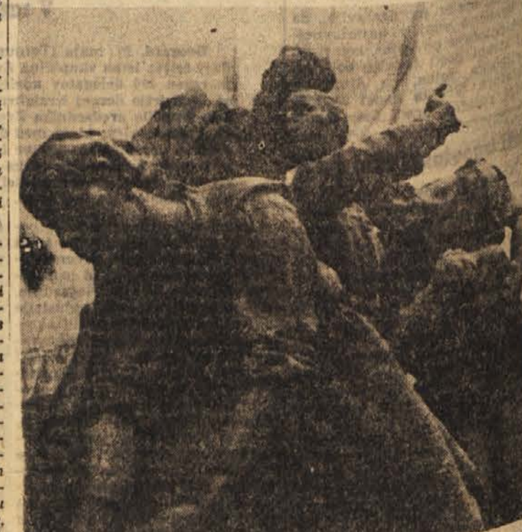
Detalj spomenika ustreljenim domoljubom, delo akad. kiparja Lojzeta Dolinarja

Kakor si Ljubljane ne moremo več predstavljati brez Plečnikovih arhitektonskih in urbanističnih spomenikov, tako so tudi Dolinarjeve plastike na ljubljanskih trgih in zgradbah zrasle s podobo našega mesta. Kdo ne pozna glave Ilirije in Napoleona na Napoleonovem spomeniku, Mojzesa na Univerzitetni knjižnici, skulptorjev pred Glasbeno šolo, ženske figure na Nebotičniku, reliefov Delo in Skrb na palači Zavoda za socialno zavarovanje, Kariatid ob obeh portalih in sedem plastik nad fasado Doma sindikata, Jurija na palači na vogalu Miklošičeve in Pražakove ulice, plastike na Njegoševi cesti itd. Pričujoča retrospektivna razstava pa bo odkrila še uso ostalo kiparjevo ustvarjalnost in s tem nudila