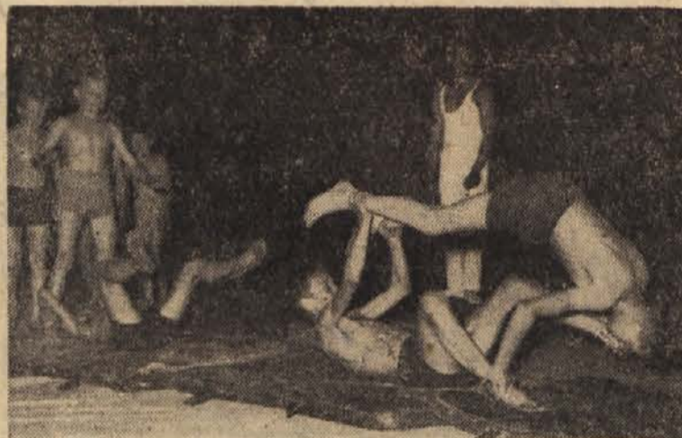
Pionirji iz Črne so nastopili v Ljubljani z raznoterostmi

za raznašanje »Ljubljanskega dnevnika« v opoldanskih urah za okraj Center in Bežigrad sprejemamo takoj. Plača dobra. Zglaste se v expeditu »Ljudske pravice« na Poljanskem nasipu št. 2