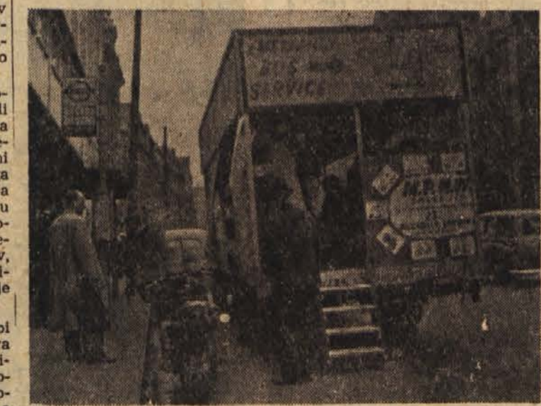
Med stavko avtobusnih šoferjev si morajo v Londonu pomagati s tovrstnimi avtomobili

Djakarta, 27. maja (Antara). Vojska je začela ofenzivo proti upornikom na jugozahodu Celebesa. Potopili so 4 uporniške ladje. V prvem spopadu je bilo ubitih 30 upornikov. V luko Pare na jugu Celebesa so poslali nova ojačenja, da bi premagali še ondote zadnje uporniške skupine. Vojska je obkolila tudi uporniške sile v Djailolu, glavnem mestu otoka Halmahere na severnih Molukih.