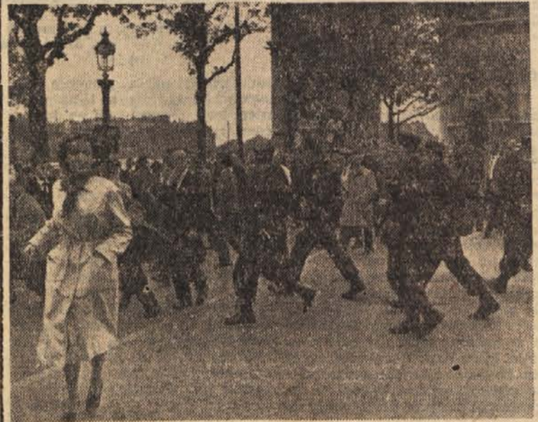
Zadnji ponedeljek je morala pariška policija še enkrat intervenirati proti ponudistom in degolovcem, ki so hoteli demonstrirati okrog Slavoloka zmage, potem je spriče izjemnega stanja nastal mir na pariških ulicah in trgih, ki pa ni nič zmanjšal dramatičnega zapleta francoske krize zaradi vojne v Alžiriji