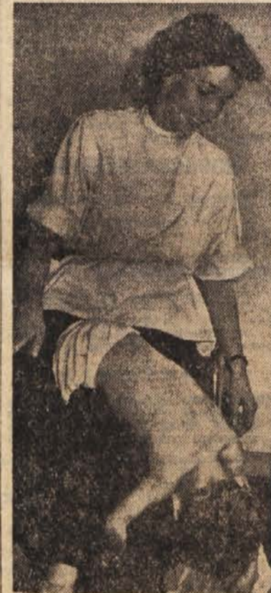
Sodobna znanost se na razne načine bori proti otroški paralizi. Nedavno so v Hamburgu odprli posebno šolo, v kateri usposabljujejo za življenje mlade žrtve otroške ohromelosti. Naša slika kaže medicinsko sestro in šestletnega dečka pri »telovadbi«. Štirinajstkrat je deček s hromimi nogami zamašil pobrati s tal robec, pri petnajstem poskusu pa mu je uspelo.

Nad Bruxellesom se je pred dnevi utrgal oblak. Dež je vdrl tudi v sovjetski paviljon. Streha nad razstavljenim tekstilnim blagom in preprogami je puščala, oboje je skupno z gasilci celo uro reševalo dragocene preproge. Sela po daljšem trudu jim je uspelo rešiti posamezne razstavne predmete. Zaradi silnega naliva se je pokvarila tudi električna napeljava v paviljonu.