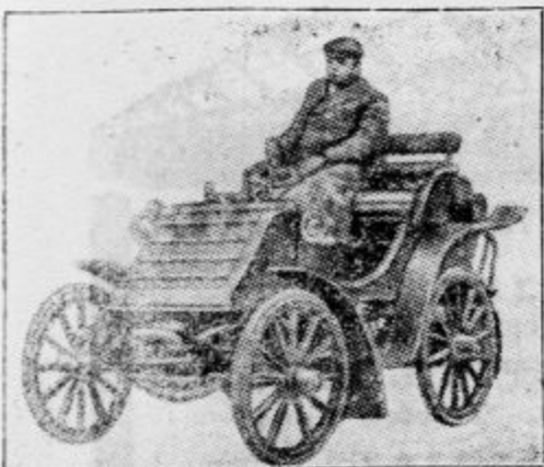
Prvi avtomobil tvrdke Sunbeam, ki se je l. 1899 pojavil na londonskih ulicah.