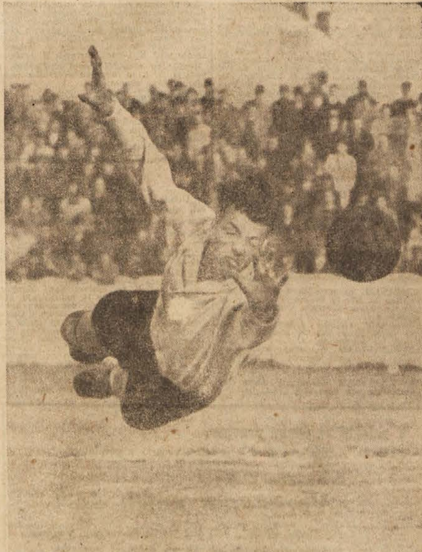
Good...