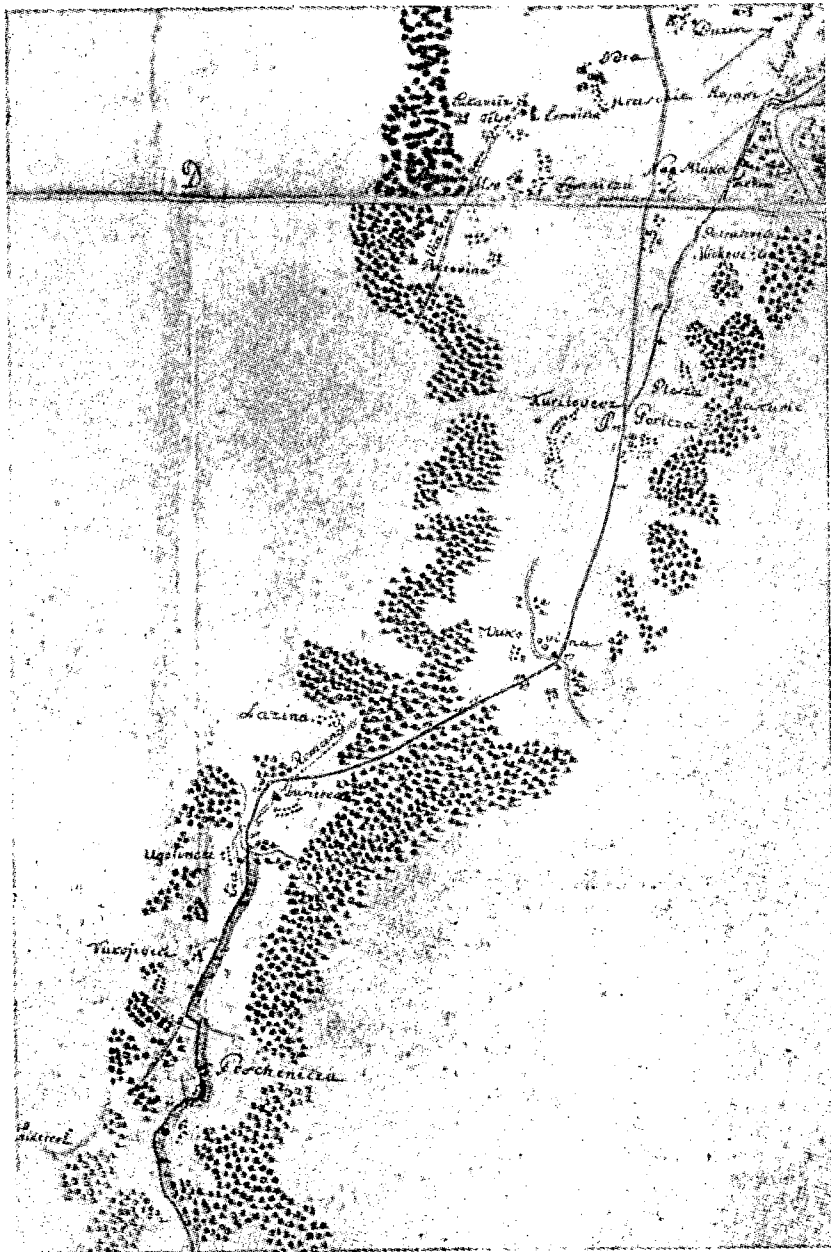
Sl. 1. ::::: Stara rimska cesta Cesta Emona—Siscia, po rokopisni karti iz leta 1789, »Situation der Strassenzüge in Agramer Comitatus«. Sedaj v mestnem muzeju v Zagrebu