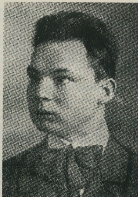
JOŽE PERTOT. Bil je med prvimi uredniki DELA. Fašistična policija ga je aretirala v uredništvu. Umril je zaradi posledic mučenja v zaporu