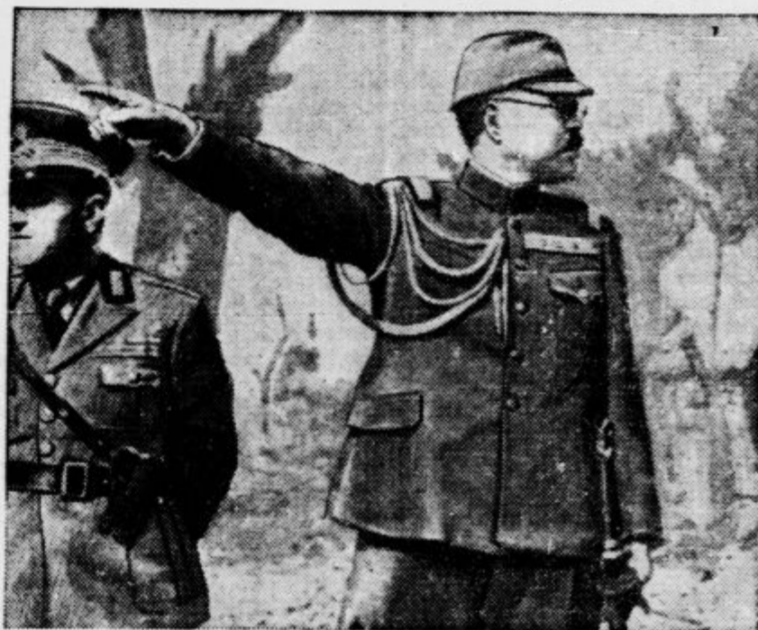
Japonski general Harada, najvišji častnik za vrhovnim komandantom japonskih čet pri Nankingu