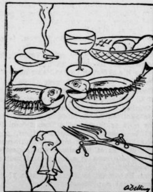
Pomenek na mizi »Nu, prijatelj, kako vam je kaj pri du« (»Delling«)