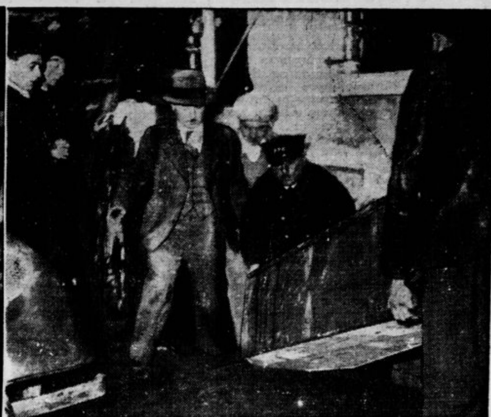
Levo: Polcija in ljudstvo pred vilo zločince Weidmanna v St. Cloudu — Desno: Iz vile odnašajo napol strohnelo truplo plesalke Joane de Kovenove.