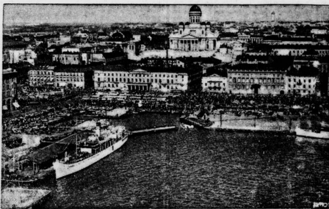
Dežela tisočerih jezer, Finska, je obhajala pred kratkim dvajsetletnico svoje državne samostojnosti — Na sliki: Helsinki, prestolnica Finske, s pristaniščem