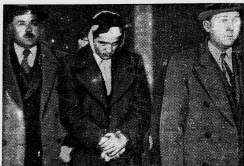
Weidmanna peljejo detektivi v zapor

Weidmann priznava zdaj še šesti zločin, umor neke guvernante iz Alzacije