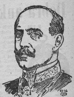
König Konstantin von Griechenland

čitatelji njegovo soprogo Sofijo ter njegovega sina, prestolonaslednika princa Jurja.