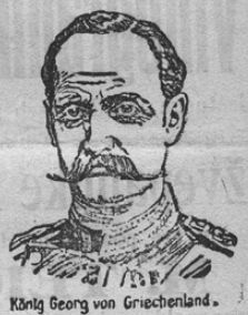
König Georg von Griechenland.