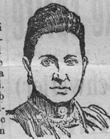
Königin Olga v. Griechenland

Kakor smo že poročali, bil je kralj Juri od nekega propalega zločinca v Saloniku umorjen. Na vrhuncu svoje slave umorjeni kralj bil je danski princ. Dne 30. marca 1863 se ga je na Grškem za kralja izvolilo. V času svojega vladanja imel je velike boje in neprijetnosti. Dostikrat se je majal njegov tron, to zlasti ob koncu nesrečne turško-grške vojne. V tej balkanski vojni pa je dosegel kralj Juri vrhunc svoje slave in čakala ga je lepa bodočnost. In v tem hipu zadela ga je krogla morila. Naša prva slika kaže umorjenega kralja Jurija. Poleg njega vidimo njegovo soprogo, kraljico Olgo; kakor znano, je kraljica Olga ruska veleknežinja. Naslednik umorjenega je njegov najstarejši sin Konstantin, ki je zdaj 45 let star. Oženjen je s prusko princezino Sofijo in je vsled tega svak nemškega cesarja Viljema II. V omenjeni turško-grški vojni imel je Konstantin toliko nesreče, da je moral na zahtevo ljudstva iz grške armade izstopiti. V sedanjih vojni pa je to sramoto z velikimi zmagami (zlasti pri Janini) popravil. Prinašamo tudi sliko tega novega kralja Konstantina. Obenem vidijo naši