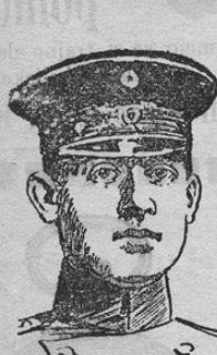
Kronprinz Georg v. Griechenland.