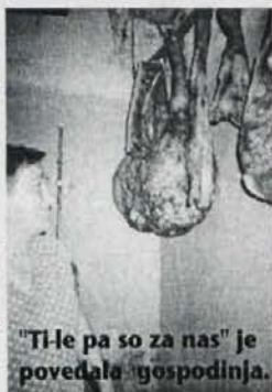
"Ti-le pa so za nas" je povedala gospodinja.

Ostre reakcije oblasti bi seveda pomenile začetek konca neke dejavnosti, ki je bila v Izoli pred davnimi leti zelo razširjena saj je bilo samo v mestu več kot trideset derif v katerih so poceni zabavo našli mnogi izolski kmetje in delavci pa tudi nekateri turisti.