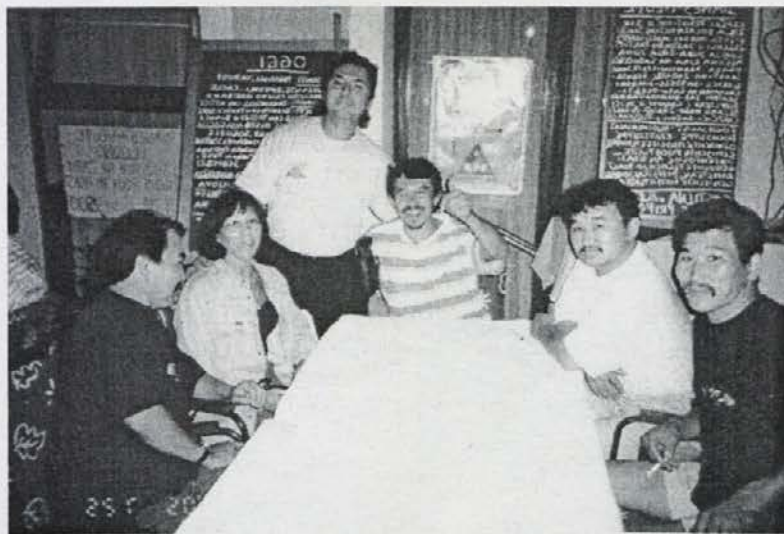
Koncert Huun Huur Tu , pevcev in godcev iz Tuve v južni Sibiriji je minil v magičnem vzdušju, čeprav so bili fantje več kot normalni ljudje. Drugi dan so celo odpeli skupaj z Grki Lakis & Achwach , pred njihovim koncertom pa so jih pogostili pri Ribiču in povedali so, da so naše ribe skoraj tako dobre kot njihove, le da so malo bolj slane.