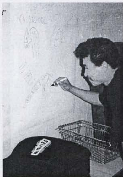
Na steno avtogramov v garderobi Mediteran festivala so se podpisali s temi nenavadnimi črkami in slikami (zgoraj) Koncerte snema tudi televizija. Brez skrbi, to ni koprška TV, saj se tej doslej še ni zdelo vredno priti na festival. Zdaj, ko imamo svojo pa je niti ne rabimo. (spodaj)