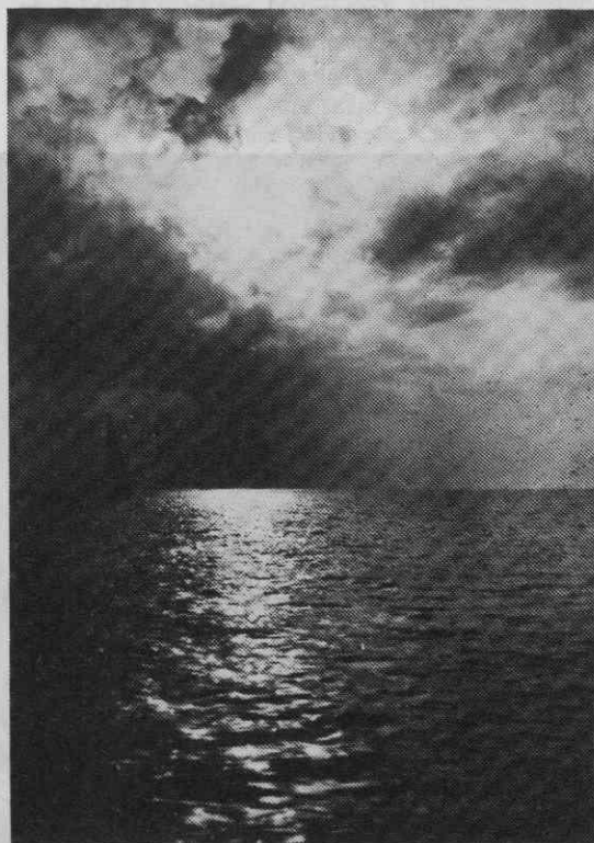
Avgust Berthold, Morje z jadrnico, gumi postopek, pred 1914, 33 x 25 cm. Zasebna last.

Leta 1910 je Berthold v že navedenem oglasu sporočil javnosti: »Na razpolago je tudi Roentgen aparat«. Nekaj izjemnega je ta podatek v fotografskih oglasih. Röntgensko fotografsko napravo si je menda Berthold kar sam uredil, slikal pa je z njo okostja po naročilu Narodnega muzeja. Po letu 1919 naj bi bil ta röntgen oddan v bolnišnico, kjer se je sled za aparaturo izgubila. 20