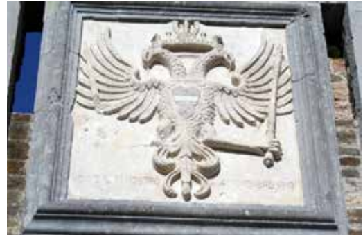
Habsburški dvoglavi orel