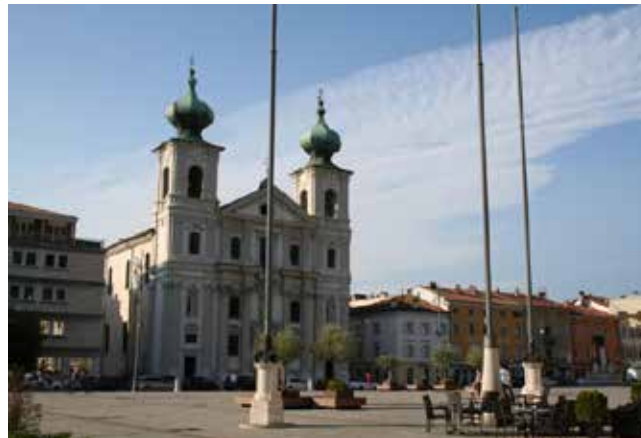
Cerkve sv. Ignacija na Travniku v Gorici