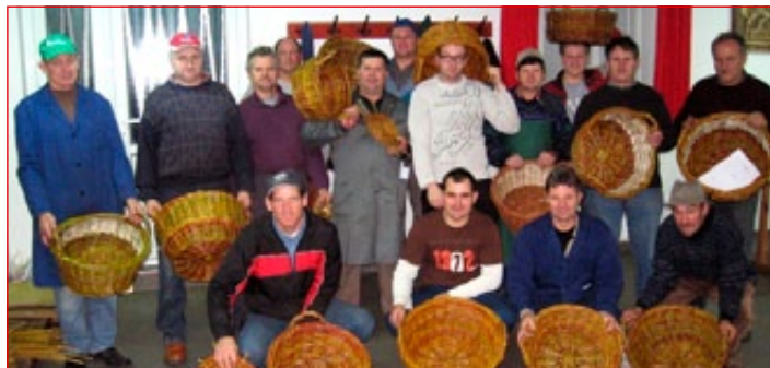
Udeleženci tečaja pletenja iz vrbovih šib

Biotehniška šola Ptuj – izziv za mlade in odrasle. Spoznajte nas!