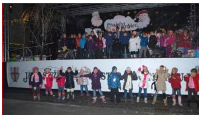
OŠ Ljudski vrt