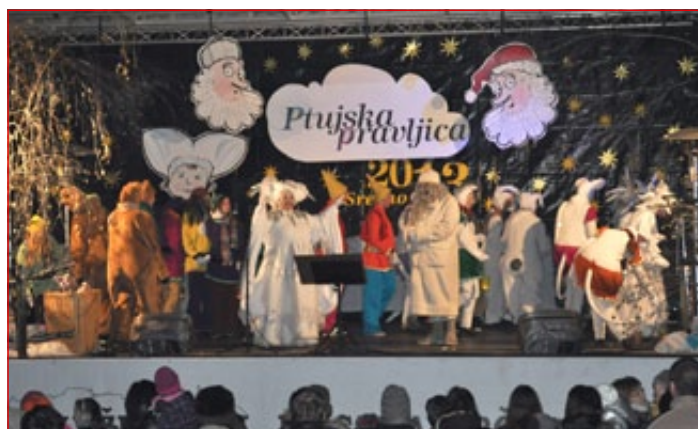
Dedek mraz in teta zima na odru

Več o sejmju si oglejte na fotografijah.