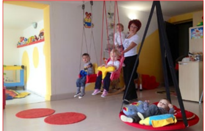
Zasebni zavod za varstvo otrok Zajčki s sedežem v Rabelčji vasi 40 trenutno šteje osem otrok v starosti med enajstimi meseci do treh let.

V posebej urejeni kuhinji nudijo štiri sveže obroke uravnotežene hrane, prav tako pa so otrokom ves čas na razpolago sveži naravni napitki, kot na primer