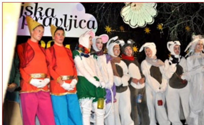
Društvo prijateljev mladine