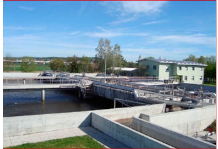
Centralna čistilna naprava Ptuj

– Čistilna naprava Kidričevo : ima kapacitete 8500 populacijskih enot (PE), izvedena je kot sekvenčna biološka naprava