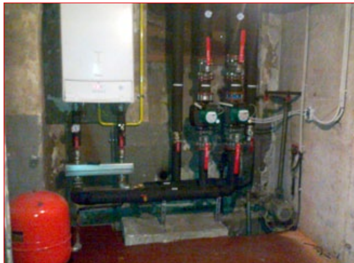
Po izvedeni investiciji – plinski kondenzacijski kotel z inštalacijo

Obiskovalcem bo tako omogočeno prijetnejše bivanje in počutje ob gledanju predstav, obenem pa bomo zagotovili zmanjšanje porabe energije. Celotna investicija je znašala 16.854,36 EUR (z DDV), Mestna občina Ptuj je pridobila 3.462,86 EUR subvencije v okviru razpisa.