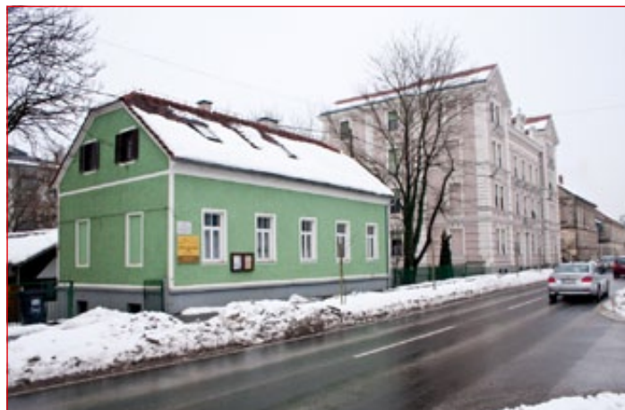
Dom krajanov dr. Jožeta Potrča na Potrčevi cesti

»Vrtičkarstvo je bilo na Ptujju zelo živahno, sploh v ČS Center je kar nekaj površin, ki so namenjene tej dejavnosti – med