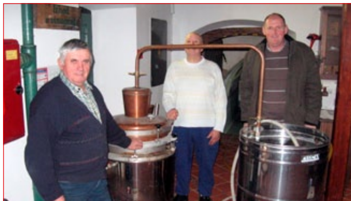
Udeleženci pri predelavi sadja v žganje

Izvedbo usposabljanj nadaljujemo tudi v zimsko-spomladanskem času do junija 2013, ko bomo končali drugi sklop usposabljanj, v jeseni 2013 pa bomo izvedli še tretji sklop. Za kandidate smo v drugem sklopu pripravili 15 brezplačnih usposabljanj: čebelarstvo, izdelava načrta proizvodnje na kmetijskem gospodarstvu, trženje in prodaja na kmetijskem gospodarstvu, pletenje iz vrbovih šib, podjetno načrtovanje in organiziranje prireje mleka, izdelava spominkov in dekoracij na tradicionalni osnovi, optimizacija dela s kmetijsko mehanizacijo, promocija kmetijskega gospodarstva s pomočjo IKT, varnost in zdravje pri delu na kmetiji, kmetijska politika in zakonodaja na področju kmetijstva, drobnica, izdelava kalkulacij na kmetijskem gospodarstvu, podjetno načrtovanje in organiziranje kmetijske proizvodnje, ureditev kmečkega