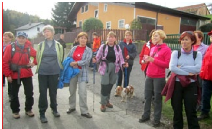
Prvega organiziranega pohoda po etapi Slovenjgoriške planinske poti od Vurberka do Term Ptuj se je udeležilo blizu 120 pohodnikov iz Slovenije in Hrvaške.

Vsak mesec v okviru Planinskega društva Ptuj organizirajo najmanj štiri izlete. »Ljudi vabimo na poti, kot je Aškerčeva pot v februarju, ter tematske poti, npr. Zdravju naproti. To so predvsem nižja sredogorja, saj s tem spodbujamo ljudi, da hodijo v vseh letnih časih. Po želji članov našega društva razporedimo pohode po vsem letu. Tradicionalno se odpravimo na Goro Oljko, opravimo nekaj visokogorskih izletov ter se vsako leto udeležimo vincenkovanja. Tukaj je še tradicionalni izlet na Triglav konec julija, ki ga vodi predsednik društva. Leto pa zaključimo 26. decembra s pohodom na Donačko goro. Predlani