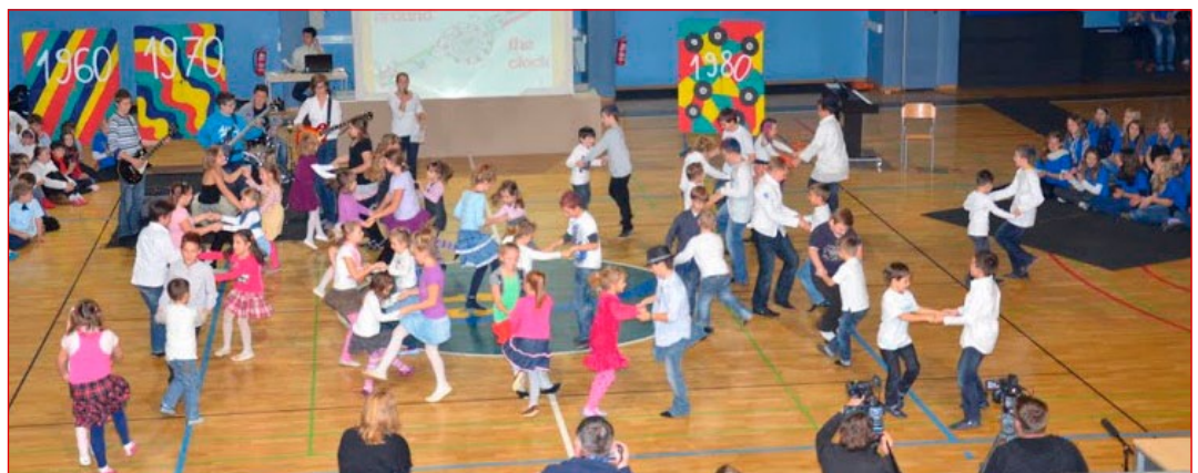
Na obeh šolah je nastopalo skupaj okrog 400 otrok

Zadovoljstvo na obrazih in solzice v očeh številnih babic in dedkov so pričale, da sta jim prireditvi bili zelo všeč. Otroci so se na igriv in prikupen način svojim starim staršem zahvalili za vso ljubezen, znanje in izkušnje, ki jih od njih prejema.