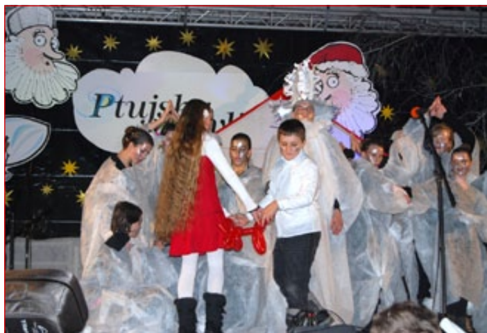
OŠ dr. Ljudevita Pivka