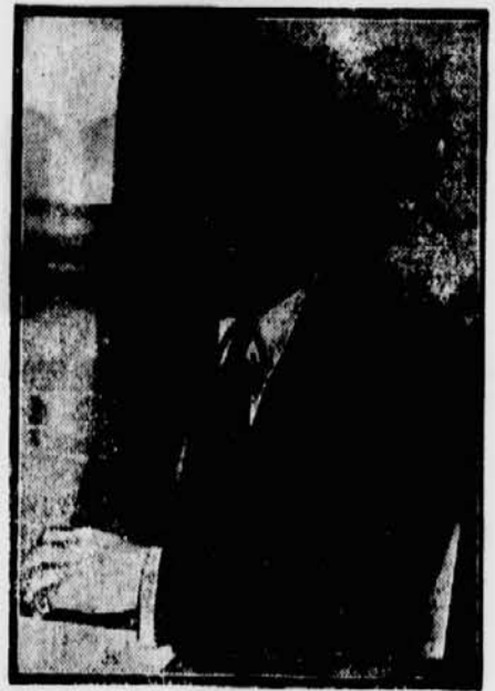
Als Nachfolger Jimmy Walkers, der bekanntlich wegen einer Bestechungsaffäre zurücktreten mußte, ist Joseph McFadden zum Oberbürgermeister von Newyork ernannt worden.

vorzeitige Reichstagsauflösung eine politische Aussprache im Reichstag zu verhindern wünscht. Die Reichsregierung sieht vielmehr einer solchen Debatte mit großem Interesse entgegen, weil sie sich von ihr eine sehr nützliche Aufklärung des deutschen Volkes verspricht und weil sie keine Möglichkeit unberührt lassen möchte, auch im Reichstag eine Mehrheit für ihr Programm zu finden.