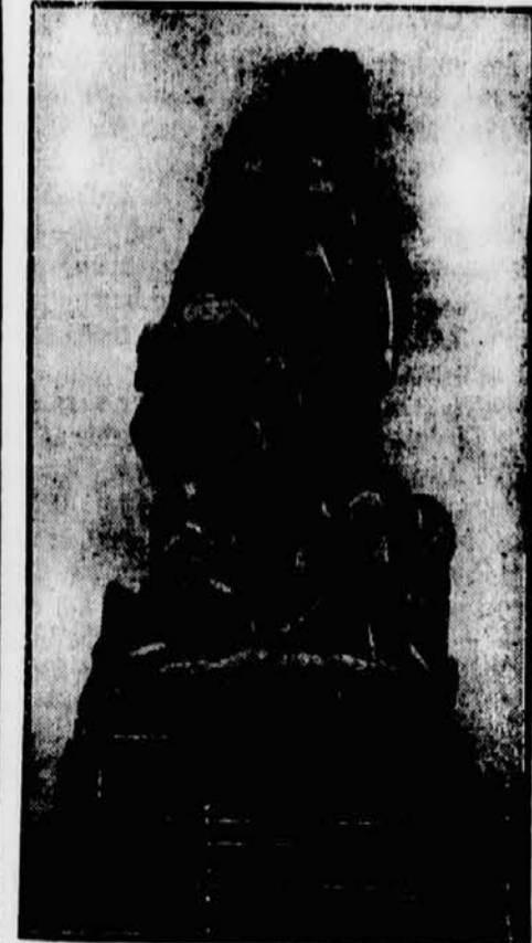
Ist jetzt durch den französischen Staatspräsidenten am 18. Jahrestage der Marne-Schlacht in Meaux eingeweiht worden.