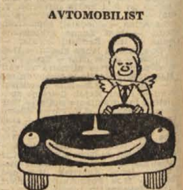
... v lastnih očeh