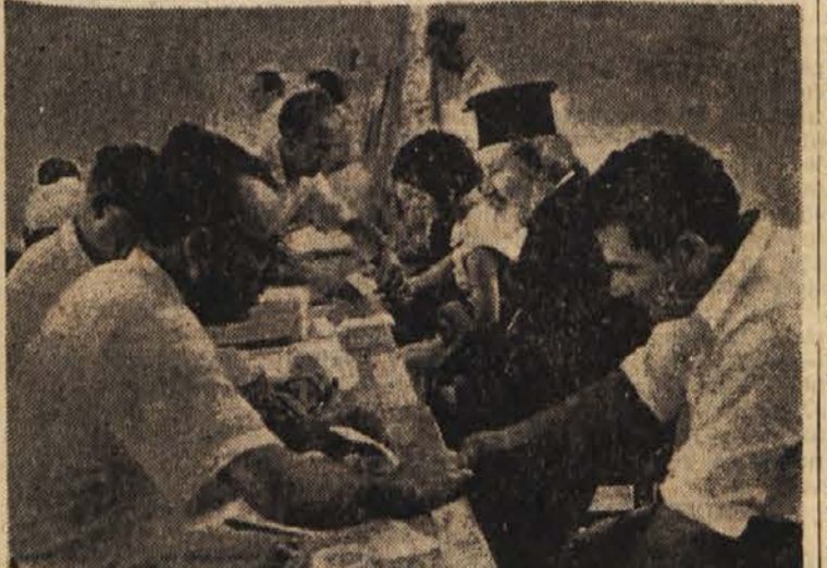
Ukrep, ki je bil zaman: tako so Britanci v Nikosiji in drugod na Cipru posneli prstne odtise vsemu prebivalstvu, da bi uporniški EOKA laže prišli do živega. Toda upor se ravno zdaj silovito nadaljuje.

Bona, 3. sept. (Reuter). Več velikih tovarnz za proizvodnjo motornih koles je odustilo ali pa se namerava odustiti večje število delavcev in omejiti proizvodnjo. Tako so v zadnjih tednih podjetja BMW in tovarna motorjev NSU odstopile 1200 delavcev. BMW je sklenila do novembra avesti 36 namesto 45-urni delovni teden. Tovarna Regensburg Stahle in Metalbau je vnaprej obvestila 100 izmed skupno 600 delavcev, da bodo odpnjeni. Sodiijo, da je do tega prišlo, ker je v Zahodni Nemčiji čedalje več povpraševanja po majhnih avtomobilih, medtem ko zanimanje za motorna kolesa in skuterje stalno narašča.