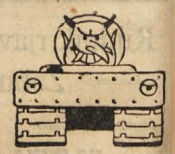
... v očeh svojega sinka