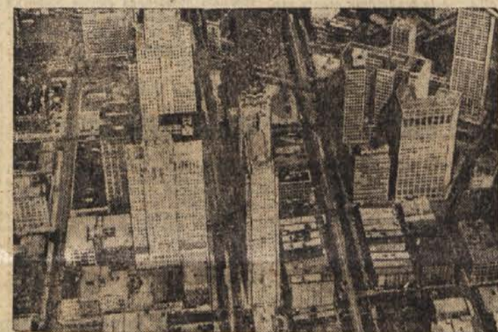
Detroit, središče ameriške avtomobilске industrije

Nekdanji izpostavljeni položaj proti Siauxom, rojstni kraj Bufala Billa in postaja poštnih kočij, Nords Plata je bila videti