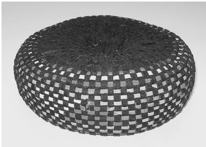
Zelo lep svitek s Planine nad Golico (E 1971).

V grobem ločimo dva tipa okrasnih vzorcev. Največ svitkov ima vertikalne trakove (trakovi, ki so oviti okrog polnila) črne, mednje pa so ob zunanji strani vpleteni trakovi živih barv (rdeče, zelene, rumene, bele, redkeje modre, oker, sive, rjave, oranžne, marelične, turkizne, vijolične in roza), ki tvorijo različne vzorce trikotnih, trapezastih in drugih oblik. Izdelava takih vzorcev je zahtevna in natančna, zato predvidevamo, da so ti svitki obrtniški izdelek. »Spodnji« in »zgornji« del (kjer se svitek dotika glave oz. bremena) je črne barve. Take svitke hranijo tudi mnogi informatorji kot spomin na mame, babice, tete, nihče pa ne ve, od kod so ti svitki prišli k hiši oz. kdo jih je izdelal.