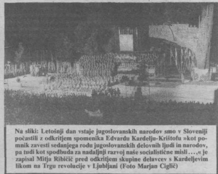
Na sliki: Letošnji dan vstaje jugoslovanskih narodov smo v Sloveniji počastili z odkritjem spomenika Edvardu Kardelju-Kristofu »kot pomnik zavesti sedanjega rodu jugoslovanskih delovnih ljudi in narodov, pa tudi kot spodbuda za nadaljnji razvoj naše socialistične misli...« je zapisal Mitja Ribičič pred odkritjem skupine delavcev s Kardeljevim likom na Trgu revolucije v Ljubljani

Vsem dobitnikom letošnjih visokih priznanj tudi naše iskrene čestitke.