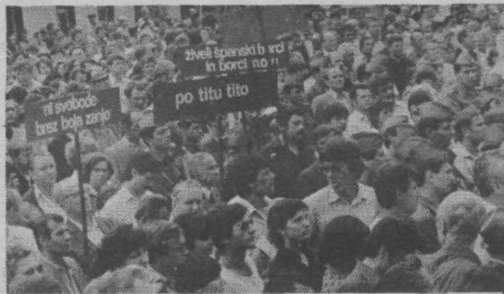
Tudi po Titu-Tito, Živeli španski borci in borci NOV, Ni svobode brez boja zanjo. Računajte na nas, Kolikor bomo delali, toliko bomo imeli itn. so bile parole, ki so izražale razpoloženje množice pred prazno, med njo in po njej.