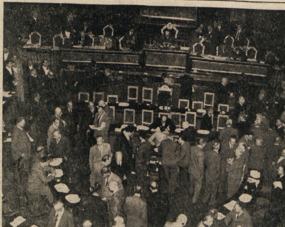
Glasovanje v italijanskem senatu za izvolitev predsednika

ELIZABETH, 26. — Bivši predsednik Truman je imel včeraj prvi govor, odkar je v preteklem januarju zapustil Belo hišo. Govoril je pred narodno konvencijo društva rezervnih oficirjev. Izjavil je, da če Sovjetska zveza iskreno želi zmanjšati sedanjo mednarodno napetost, bi morala biti ZDA v položaju, da se lahko pogajajo kot močna sila. Kritiziral je nato sklep o znižanju ameriškega obrambnega proračuna za 5 milijard dolarjev. Nato je Truman izjavil, da je odbor glavnih štabov že leta 1951 pripravil vojaški program. Načelniki glavnega štaba so vztrajali naj bi uresnili vojaške cilje, ki jih je vseboval ta program, takoj po letu 1954, ker so predvidevali, da bo sovjetska vlada prav v tem razdobju nakopila tako količino atomskih bomb, ki bi lahko spravila ZDA v zelo nevarno položaj.