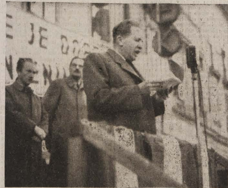
Predsednik vlade LRS Miha Marinko govori volivcem Ljubljane

Naši nasprotniki skušajo trditi, da je prav v tem razlog, zakaj nasprotujejo priključitvi Julijske krajine in Trsta k Jugoslaviji, zakaj hočejo Trstu naprtiti kolonialni statut, zakaj nam ne vrnejo naših donavskih plavnih objektov in nam hočejo škodovati, kjer koli je mogoče.