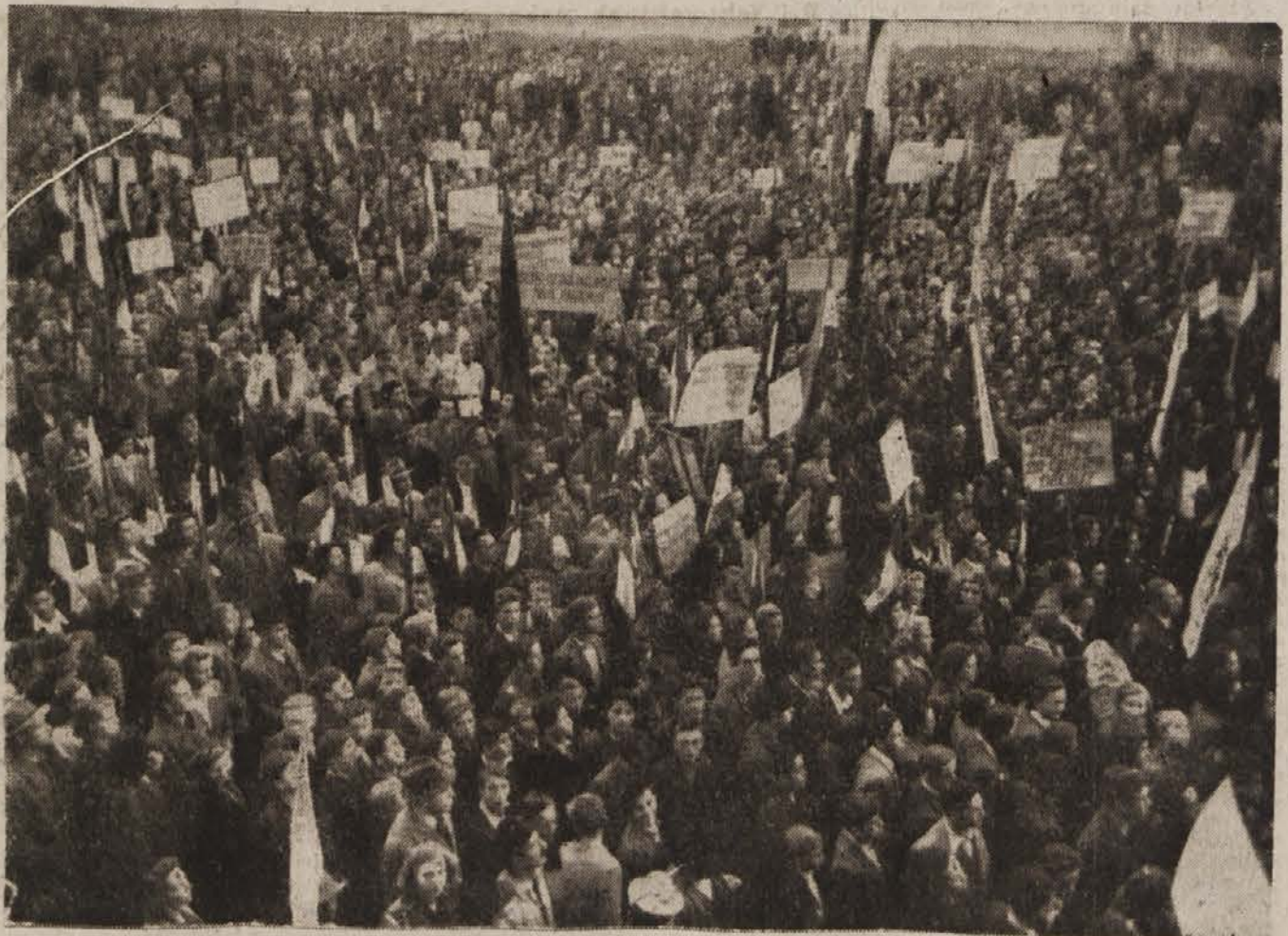
Desettisoči ljubljanskih volivcev so se zgnili na Kongresni trg