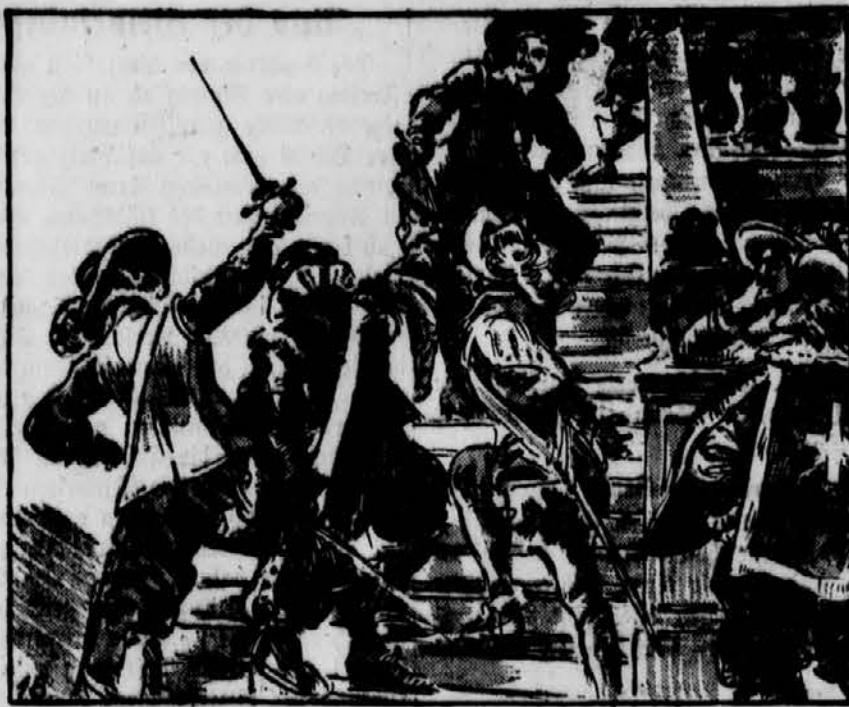
„Fidells et Fortis“

sich im Louvre bei einem Muskettier und erfuhr, daß Herr de Tréville in der Rue du Vieux-Colombier, ganz in der Nähe seines eigenen Quartiers, wohne. Das schien ihm nun ein gutes Vorzeichen zu sein, und mit Gedanken an Herrn de Tréville, der nach Schätzung seines Vaters die dritte Person des Reiches sein sollte, schlief er rasch ein.