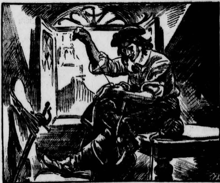
D'Artagnan in seinem Loggia

Sofort machte es sich der junge Mann in seiner Dachkammer gemütlich und gab sich unverzüglich daran, an Wams und Strümpfe die Börtchen zu nähen, die seine Mutter von einem fast neuen Wams des Vaters abgetrennt und ihm heimlich zugesteckt hatte. Dann ging er auf den Kai de la Ferraille, um eine neue Klinge in seinen Degen machen zu lassen. Auf dem Rückweg