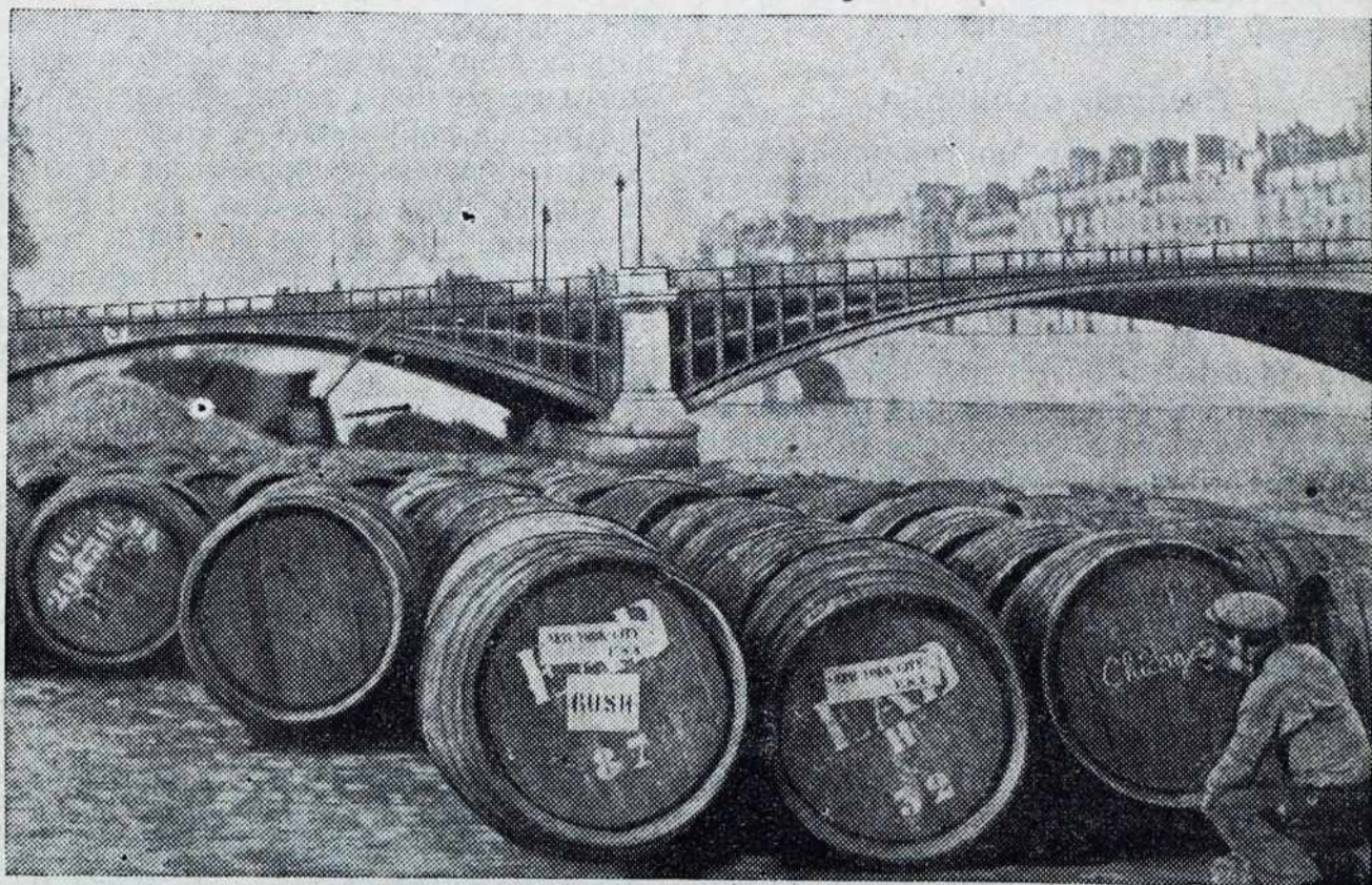
Francija spravla velke lagve (sode v Sev. Ameriko, šteri bodejo služili Amerišanom za vino.

Nemčija je dobila novo vlado. Dugo časa je trpelo, kak je Nemčija dobila novo vlado. Vlado je sestavo general Šleier, drugi ministri so večinoma pristaše Papena.