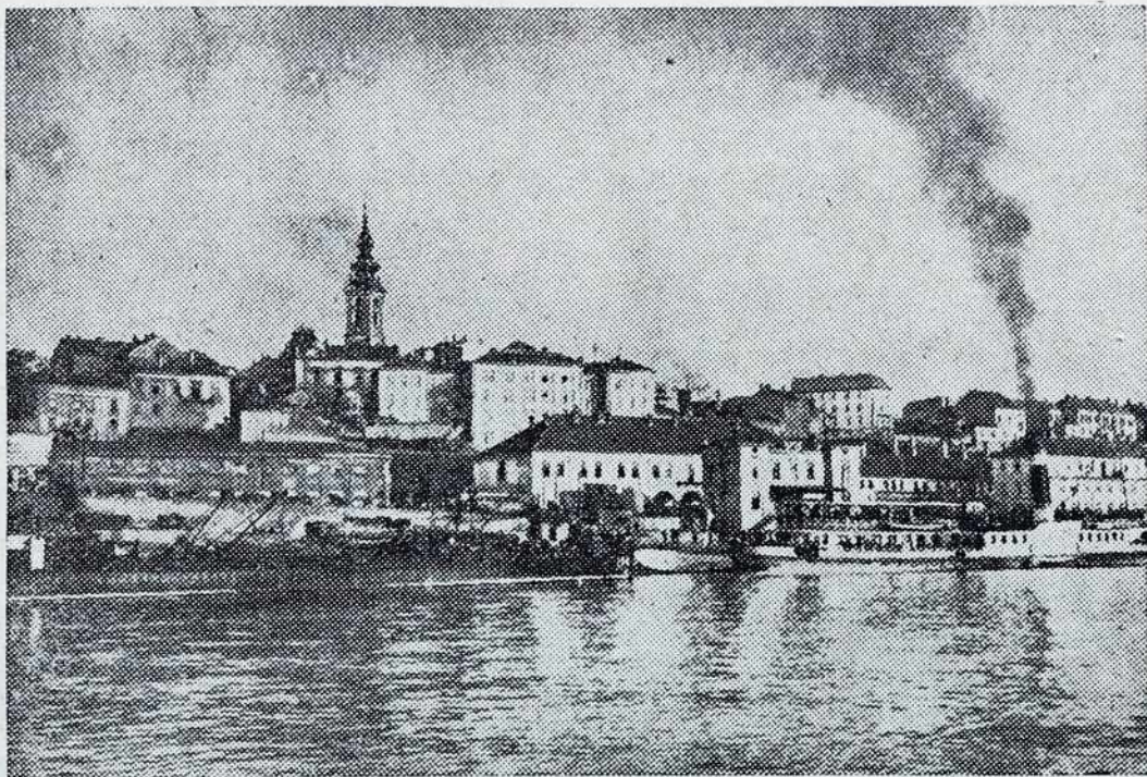
Belgrad, glavno mesto Jugoslavije.

Popravi! V zadnjo številko se je vrnilo več tiskovnih napak. Posebi opozarjamo, da bi v članki „Prekm. kniga“ na str. 3. morale stati prve 3 vrste 1. kolone za prvimi 4 v druge kol. v „Dijaškom polji“ bi se naslov morao glasiti: „Ali nam je...“