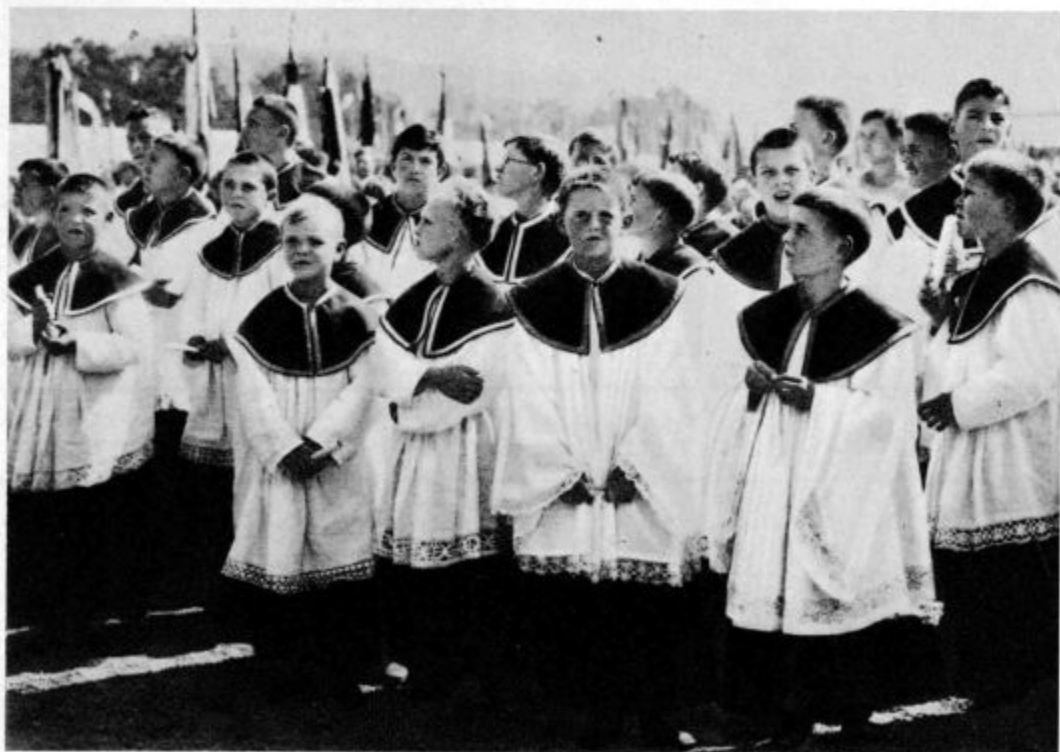
Koliko jih je . . .