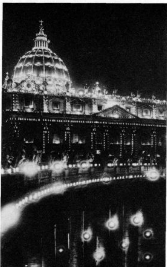
Cerkev sv. Petra razsvetljena za Don Boskovo kanonizacijo

»Druga stvar, dekleta, ki vam bo dajala moč, bodi vaša zavest, da ste vse članice ene velike družine, katere glava je mati. In ta mati je Marija. Zato se pa imenujete med seboj sestre, zato hčere Marijine. Ne prva, ne druga beseda ni prazna.