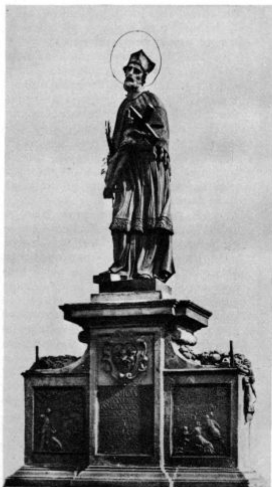
Sv. Janez Nepomuk

Prišla je tista seja in pričelo se je glasno premišljevanje o vprašanju, kaj početi z družbo.