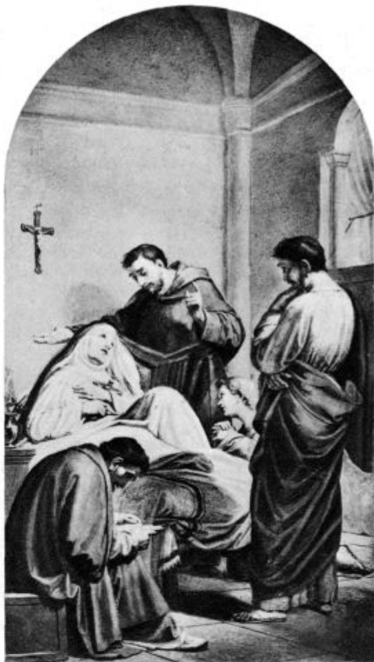
Smrt sv. Monike

Pred leti je zbolel bogat trgovec za pljučnico. Bolniški strežnik mu prigovarja, naj se da prevideti, da bo miren, potolažen in pripravljen, naj pride že, kar hoče. Zaman! Zdaj mu pripoveduje strežniški brat o dogodku, ki ga je malo dni poprej doživel: »Nedavno sem oskrboval bolnika, ki mi je duhovnik prinesel sveto popotnico.