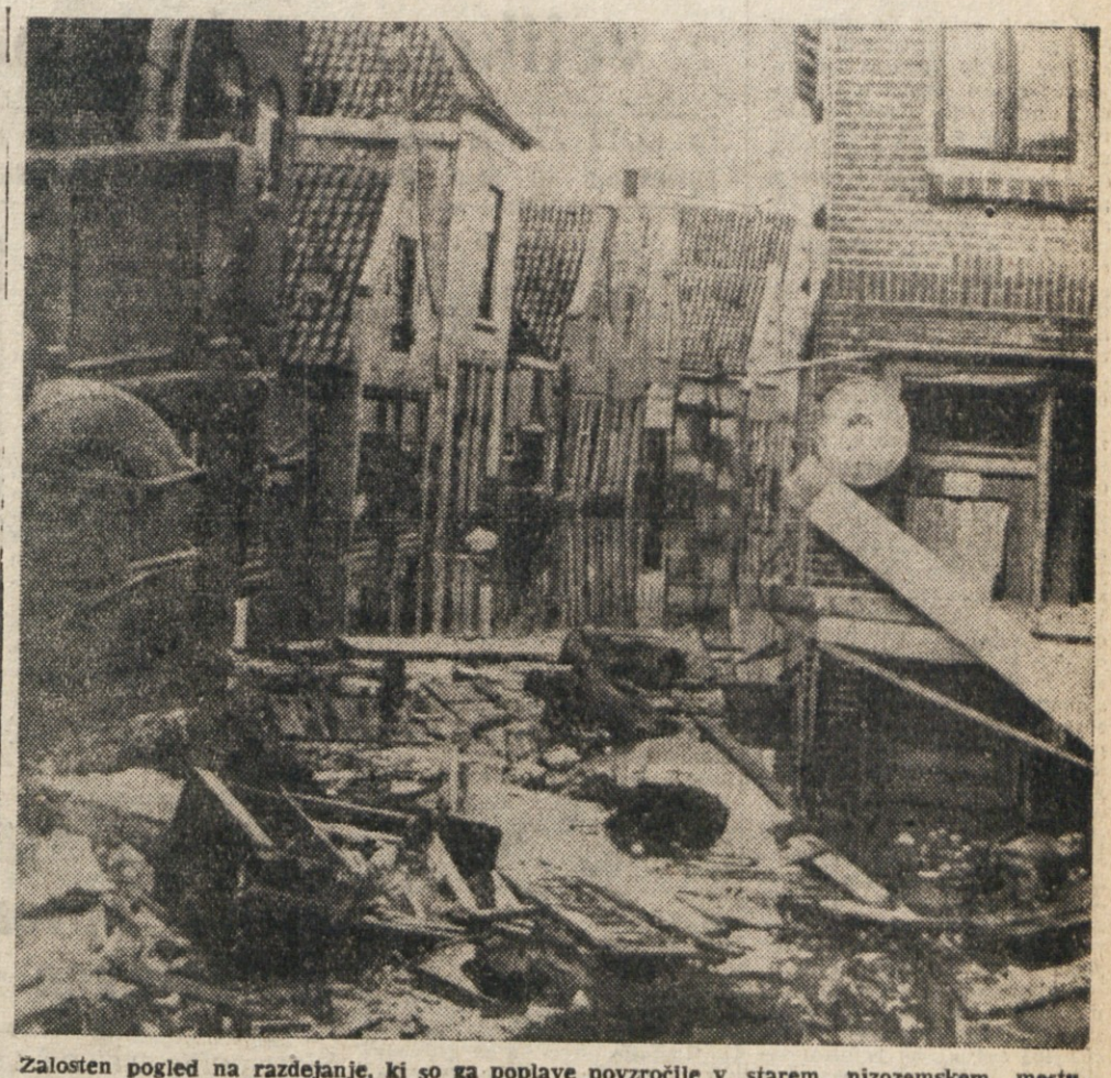
Zalosten pogled na razdejane, ki so za poplave povzročile v starem nizozemskem mestu Zieriksee na otoku Schouwen, ki je bilo vazno turistično središče.

WASHINGTON, 11. — Danes se je v Belt hiši sestel državni svet za varnost, kateremu je