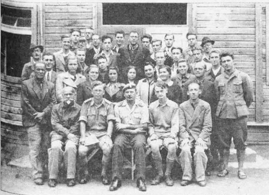
MATURANTI SLOVENSKE GIMNAZIJE V LIENZU LETA 1945:

Ti naši skriti junaki, danes mnogi že skoraj pozabljeni, so takrat pred petdesetimi leti nosili v srcih vsak svojo grenko bolečino, ki je pa niso razkazovali. Pustili so ob strani svoje osebne tragedije in priskočili na pomoč: treba je bilo vzgajati naprej našo slovensko mladino, treba je bilo graditi za bodočnost. Stradali z nami, a nikdar potarnali. Brez sredstev, skoraj brez knjig in zvezkov, lačni, raztrgni in skušntrani, a ponosni in resni, kot se spodobi pravim junakom, so se žrtvovali za nas. Za slovenski rod, za bodočnost Slovencev. Vsem njim, pa tudi množici ostalih profesorjev in učiteljic, ki že pol stoletja nadaljujejo njihovo poslanstvo: Hvala vam, tisočkrat hvala in Bog vam plačaj!