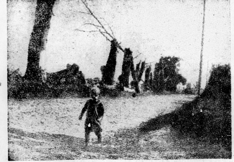
Poljska v dneh nemške okupacije

Sole v Varšavi. V varševskem šolskem okraju je danes 381 sol za predšolsko mladinu. Od 171.600 otrok v letih med četrtim in šestim letom je v teh solah 12%, medtem ko jih je bilo v začetku šolskega leta 8%. Otroci za osnovne šole je 412.400, od katerih jih šole more obiskovati 371.500. Po približni cenitvi bo v prihodnjem šolskem letu v Varšavi sami okrog 75.000 otrok, medtem ko je v 665 učilnicah prostora le za 42.000 otrok. Vseh sol je v varševskem okrožju 2174. Sol s štiri ali več učitelji je 639, s tremi učitelji 719, z dvema 456 in z enim učiteljem 294. Vseh učiteljev je tu 8260, med temi 2286 nekvalificiranih. To priča o velikih nalagah, ki jih mora izvršiti poljska prosveta.