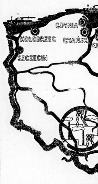
Velike vodne poti povezujejo poljske pokrajine z velikima poljskima pristaniščima Gdanskom in Szczecinom

Poleg teh treh velikih pasov, katerih naselitveni značaj se med seboj bistveno razlikuje, pa se odražata še dva manjša pasova zaradi posebnega značaja svoje kolonizacije. To je naselitveni pas na severu olinjskega vojvodstva, kjer so se preselenci izza Buga naseljevali najbolj strnjeno, ker je bila ta pokrajina v primeri z ozemlji dalje na jugu najbolj prazna. Drugi