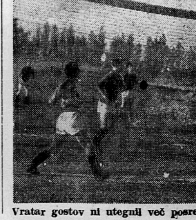
Vratar gostov ni uagnil več posredovanj in zoga je našla pot do mreže