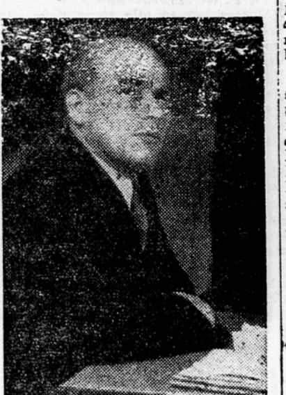
Minister za vrnjene zapadne pokrajine Vladislav Gomulka

delati v rovih že četrta leta, morejo obiskovati mestne tečaje, organizirane v industrijskih solah, po katerih se nastavlajo kot inšpektori v svojih strokah.