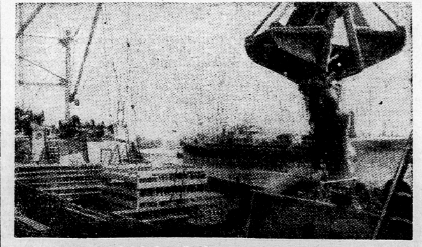
Premog je v poljskih lukah najbolj pogost in najbolj dragocen tovar