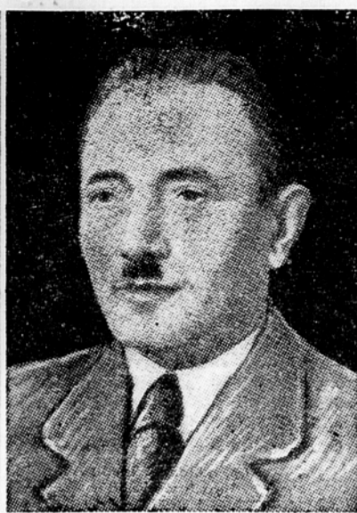
Predsednik Poljske republike Bolesław Bierut

Predvojna Poljska je bila v agrarnem pogledu prenaseljena dežela. Okrog 2 milijona kmečkih družin je živelo na posevkih, katerih površina je znašala skupno 8 milijonov 173.000 hektarov. Ker je potrebno za zdravo kmečko gospodarstvo okrog 10 ha zemlje, bi bilo mogoče živeti in se gospodarsko razvijati na tej zemlji le okrog 817.000 družin. Ostalih 1183 družin je bilo torej odvisno prebivalstvo, ki se je moralo obdržati na tej zemlji le z vednim zniževanjem življenjske ravni. K temu je treba priložiti še okrog 400.000 družin kmečkega proletariata brez zemlje. Praktično je bilo torej leta 1939 na Poljskem 1.583.000 družin brez lastne zemlje. Če računamo na vsako družino štiri do pet članov, zneslo to okrog 6,3 do 7,9 milijona ljudi.