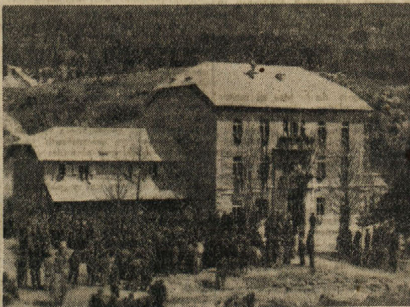
Zadružni dom v Dolu-Predmeji, ki je bil dograjen med prvimi v Sloveniji

Ta naš uspeh naj bo vsem ostalim vsem svetel zgled močne volje našega zavednega ljudstva. Njim smo dokazali, da ljudstvo zmora prav vse ter da ni ovir, ako se vključimo vsi v delo, kjer nam pomaga naša ljudska oblast z vsemi razpoložljivimi sredstvi.