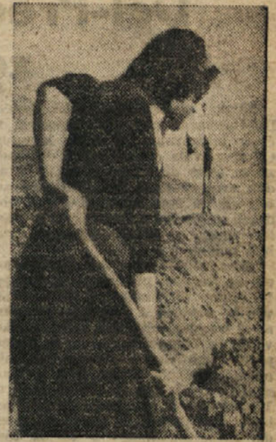
Mladinke prav nič ne zaostajajo za svojimi tovariši v delovnih brigadah

V eni izmed naslednjih točk nan je tov. predsednik poudaril važnost tekmovanja za celotno naše gospodarstvo in važnost tekmovanja pri gradnji cest v Novi Gorici. Tekmovalna komisija je zbrala potrebne podatke. Največ točk je dosegla mizarška delavnica našega gradilišča, to j 216 točk. Na drugem mestu je skupina pri regulaciji Korena, dočim i