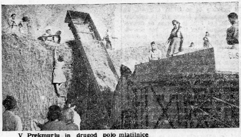
V Prekmurju in drugod pojo mlatinice

Ta dvom v pravilnost sovjetske zunanje politike je prisel najbolj do izraza tedaj, ko je vodstvo Sovjetske zveze poskušalo nastaviti nož na grlo socialistične Jugoslavije, četudi so se mnoga prejšnja dejstva govorila o tem, da so v sovjetski zunanji politiki prišla od izraza nekatera nedemokratska in napadna načela. Mar sovjetska pogodba s Hitlerjem o uničenju in razdelitvi Poljske, sporazum s Churchillom o razdelitvi interesnih sfer na Balkanu, moskovski ukaz o likvidaciji komunistične partije ZDA v smislu političnega vetra, ki je vel na teheranski konferenci »Velikih treh«, ali pa kapitulantski sporazum s Čankajevskim na škodo narodnoosvobodilnega gibanja kitajskega ljudstva, likvidacija osvobodilnega gibanja v Grčiji itd., niso vsebovali vseh potez protivojnopolitične politike o razdeljevanju vplivnih Nadaljevanje na 2. strani