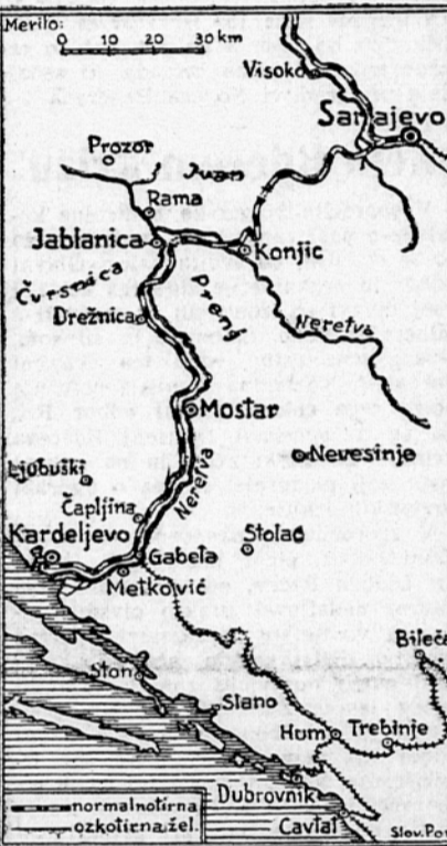
Normalnotrinska ozkotirna železnica