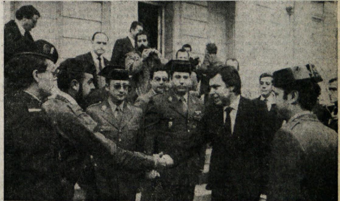
Nova španska vlada je včeraj tudi formalno prisegla pred kraljem Juanom Carlosom in bo v torek v prihodnji zasedala. Gonzalez in njegove ministre čakajo številne in zapletene naloge, zlasti na področju gospodarstva in socialne politike. Vsi ministri, razen dveh, so socialisti, njihova povprečna starost pa znaša 42 let. Na sliki: novi premier pozdravlja člane civilne garde ob prihodu v svojo uradno rezidenco v palači Moncloa