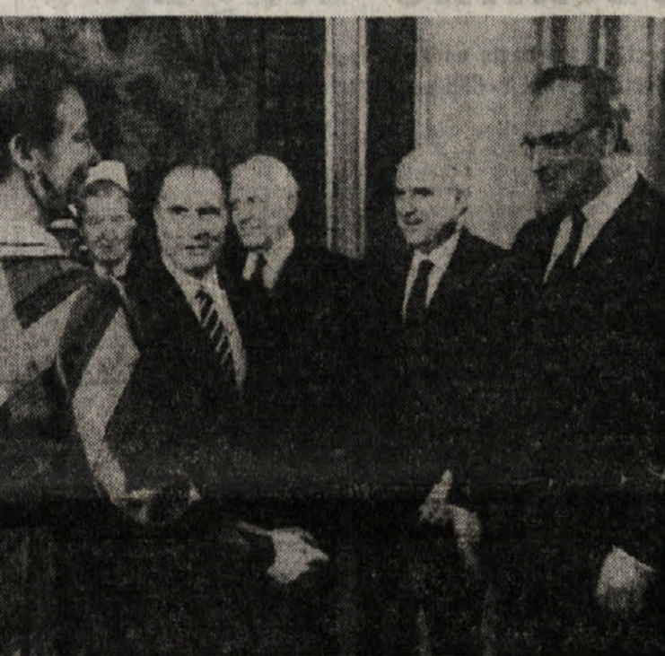
Danska kraljica Margareta II. se pozdravlja z najvišjimi voditelji držav Evropske gospodarske skupnosti pred slavnostnim kosilom, ki jim ga je priredila v gradu Amalienborg pred otvoritvijo 24. zasedanja Evropske skupnosti. Od leve angleška predsednica vlade Margaret Thatcher, francoski predsednik Francois Mitterrand, grški predsednik Andreas Papanandreu in novi zahodnonemški kancler Helmut Kohl, v ozadju na levi italijanski predsednik vlade Amintore Fanfani

Kot vse kaže pa na sedanjem 24. evropskem vrhu ne bodo sprejeli s tem v zvezi nobenih posebnih sklepov, v pričakovanju srečanja med izvršno komisijo EGS ter pristojnimi zastopniki ameriške vlade, ki o stalimi kočljivimi vprašanji, ki v tem trenutku težijo skupnost: trgovski odnosi z ZDA in z Japonsko ter vstop Španije in Portugalske v Evropsko gospodarsko skupnost. Glede slednjega vprašanja so po vsem videzu odločili, da odložijo vstop obeh prirečnih držav do leta 1985 ali še pozneje, ker je to povezano z delikatnimi problemi, kot je preustroj kmetijske politike in pa povečanje skupnega proračuna.