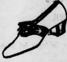
Weiß mit roter Auflage