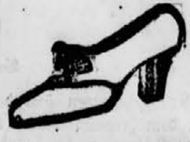
Weiß mit braun Box