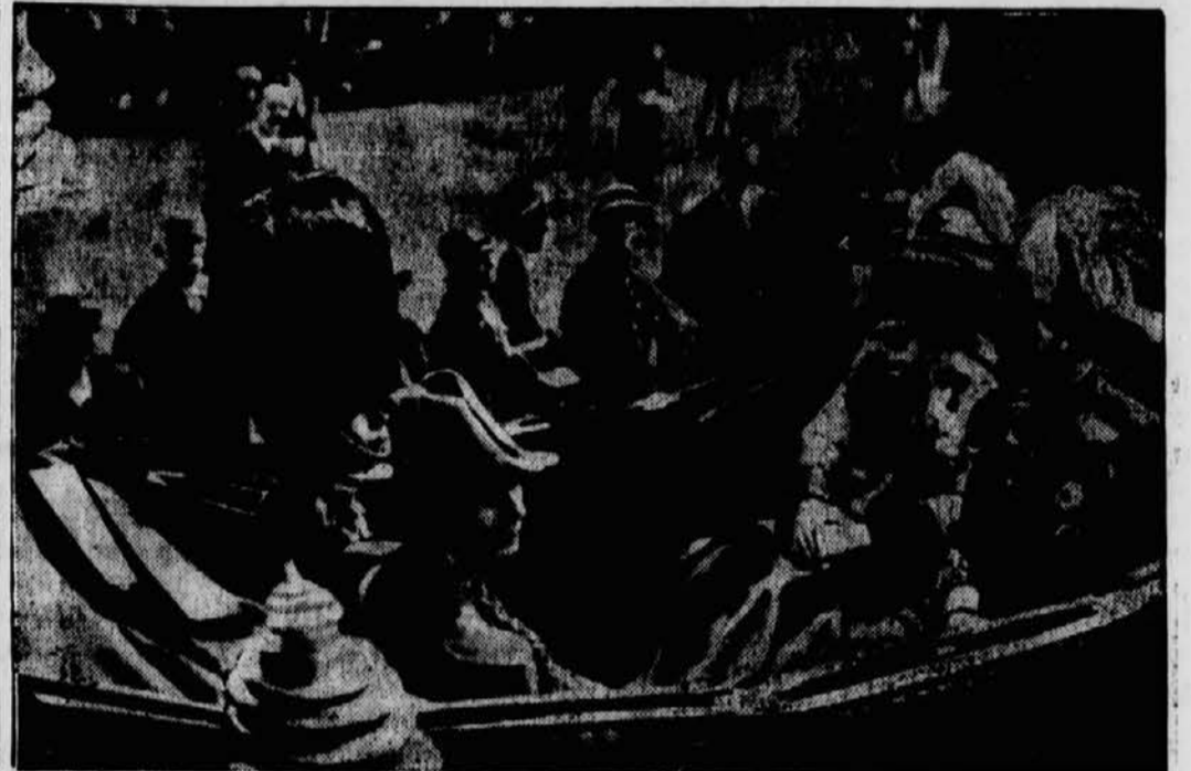
König Georg V., König Gejzal (zu seiner Rechten), der Prinz von Wales (mit Bärenmütze) und der Herzog von York in der Staatskutsche auf dem Wege zum Buckingham-Palast.

König Gejzal vom Irat stattete am Dienstag dem englischen König seinen offiziellen Staatsbesuch ab. Die Staatswache verließ unter den traditionellen großen Zeremonien. Menschenmengen säumten die Straßen Londons, um dem prunkvollen Aufzug beizuwohnen.