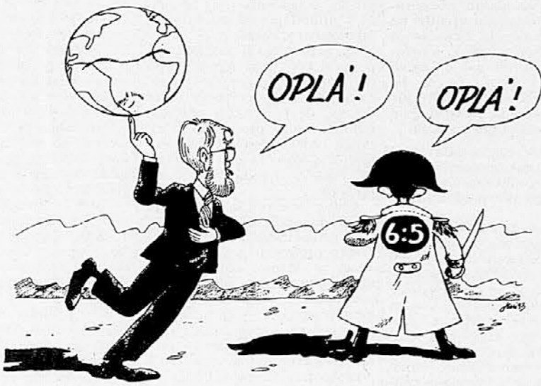
Karikatura: Franco Juri