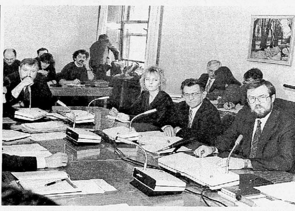
KANDIDAT ZA ZUNANJEGO MINISTRA LOJZE PETERLE MED PREDSTAVITVIJO.

LJUBLJANA, 22. januarja — Jutri se bo v Ženevi nadaljevala mirovna konferenca o Bosni in Hercegovini. Poleg sopredsednikov Cyrusa Vancea in lorda Davida Owena se je bodo udeležili predsednik tako imenovane ZRJ Dobrica Čosić, srbski predsednik Slobodan Milošević in črnogorski predsednik Momir Bulatović, pa tudi vodja bosansko-hercegovinskih Srbov Radovan Karadžić, od katerega Vance in lord Owen pričakuje, da bo »z eno besedo in brezpogojno sprejel ustavni predlog v devetih točkah.«