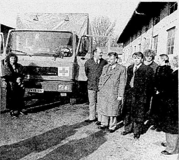
Tovornjak za prevoz pomoči beguncem iz BiH

Voljna poslanske skupine Zdrženice liste Miran Potrč je niti daljeznose posledice. Povedal je, da so člani SKD spora-