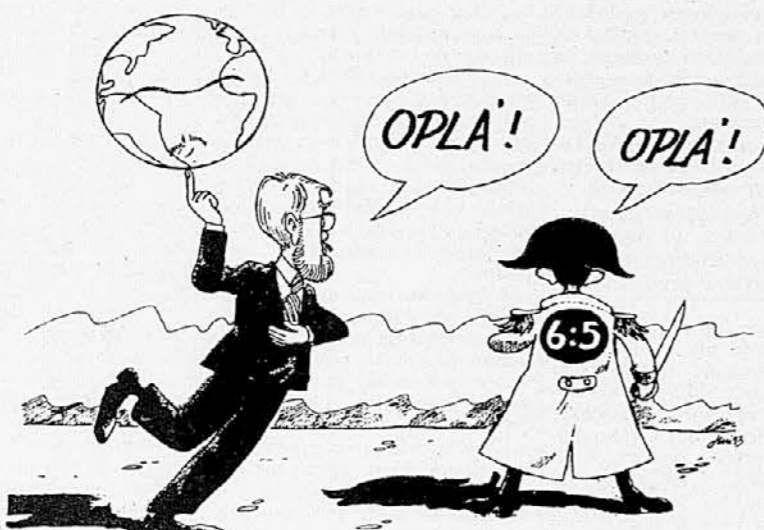
Karikatura: Franco Juri