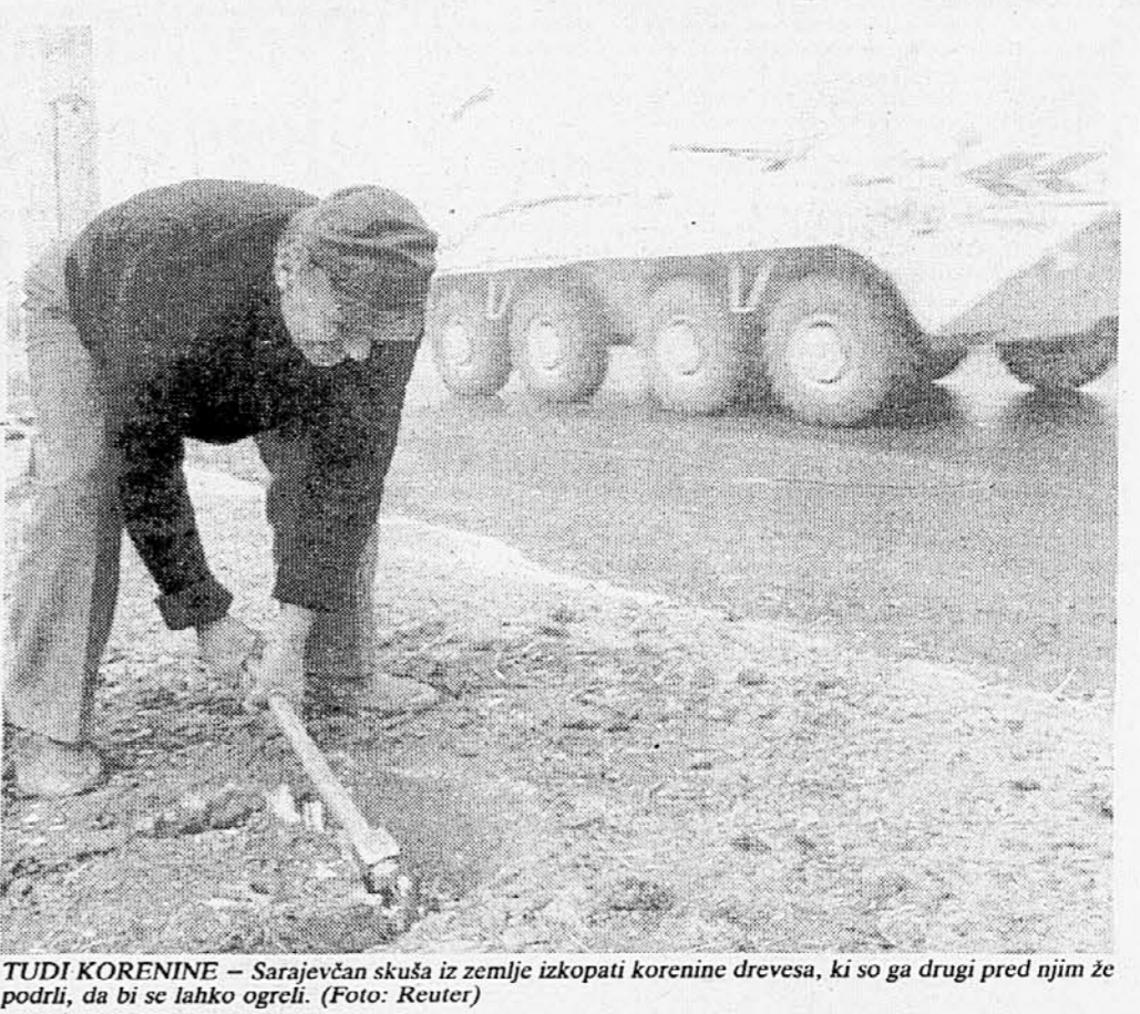
TUDI KORENINE - Sarajevčan skuša iz zemlje izkopati korenine drevesa, ki so ga drugi pred njim že podrli, da bi se lahko ogreli.

Minulo noč so Srbi z daljnoglednimi topovi obstreljevali Srebrenico. Napad z ozemlja tako imenovane Jugoslavije je trajal več ur in ubitih je bilo najmanj osem ljudi. Tiskovni predstavniki vojske BiH poročajo, da se kakih 70 srbskih tankov pomirila v Gornjem Vakufu.