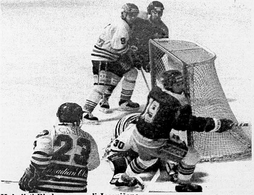
Hokejisti Bleda premagali Jeseničane BLEd, 22. januarja – Hokejisti Bleda (v temnejših dresih) so dobili povratno polfinalno tekmo končnice hokejskega DP z Acroni Jeseničani s 4:1 (0:0, 3:1, 1:0) in izid v zmagah izenačili na 1:1. Olimpija Hertz pa je tudi v Celju ugnala domače hokejiste s 7:1 (3:0, 2:0, 2:1) in vodi v polfinalnih dvobojih na tri zmage z 2:0. Na sliki prizor s tekme na Bledu. Z leve: Magazin (23), jeseniški vratar Pretnar (na leh), Anforov (19), v ozadju pa M. Smolej (9) in Stolbun. Več na 6. strani.