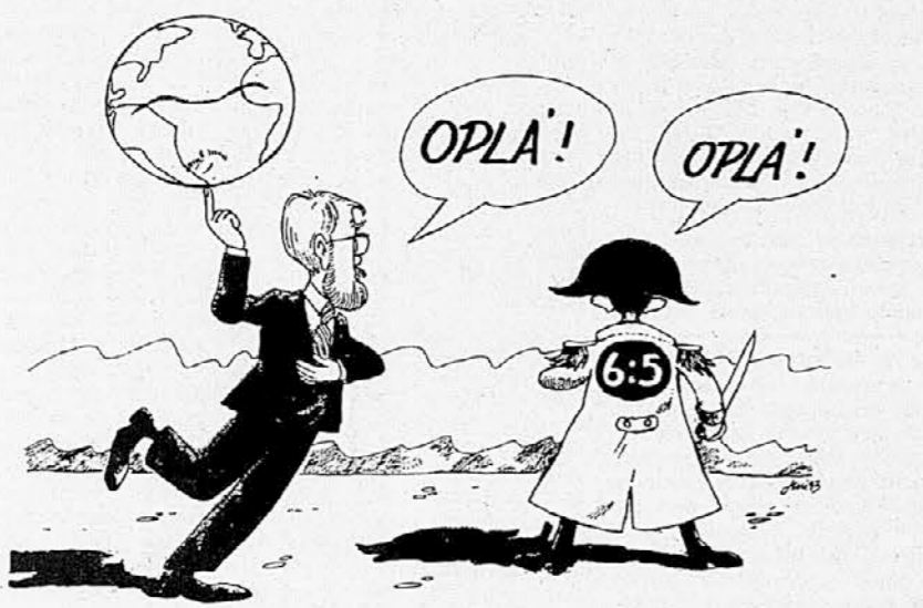
Karikatura: Franco Juri