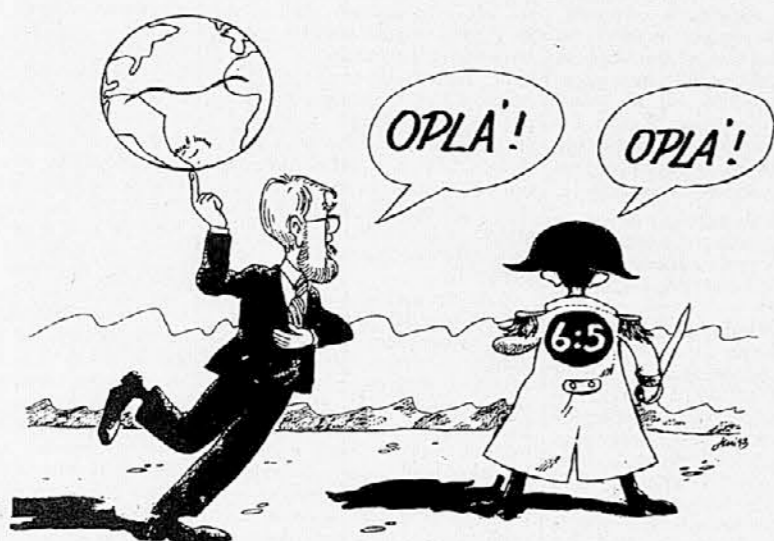
Karikatura: Franco Juri