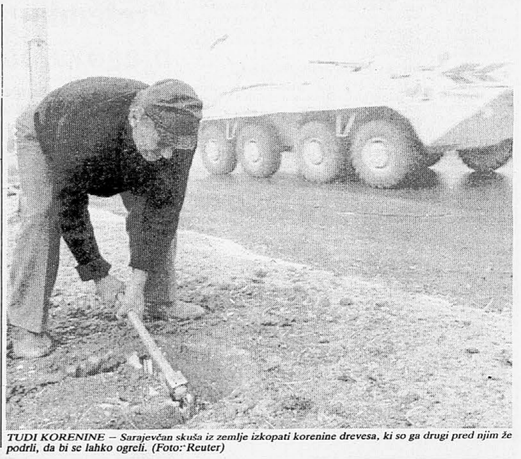
TUDI KORENINE – Sarajevčan skuša iz zemlje izkopati korenine drevesa, ki so ga drugi pred njim že podrli, da bi se lahko ogreli.