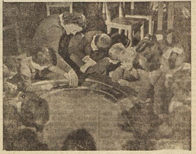
Ena najpriljubljenejših otroških iger je miniaturna železnica

In kramljali so v prijetni sobi, družine bilo je le veselje... »Joj, zdaj v zlato se kočiji v soncu še Nedelja lepa v goste pelje!«