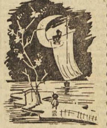
jadral z mesecem je po svetu v svojem čudnem tretjem letu ko za gumba iz zlata mesec je dobil z neba.