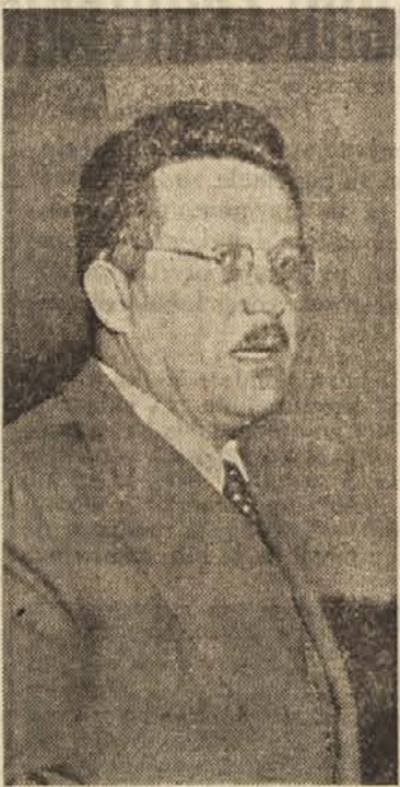
ru naših demokratičnih institucij bori za svoje interese in za svoje nazore.

»Vsakomur, ki se ga to tiče, je dejal tovariš Kardelj, »moramo jasno in odkrito povedati, da na demokratično svobodo v tej deželi računamo lahko samo tisti, ki izpolnjuje tudi obveznosti, ki jih ima spriču odgovornosti do socialistične skupnosti. Ravno o takšnem državljanu govorim v tem referatu. Mi moramo odpreti vrata slehernemu poštenemu državljanu te dežele, da se lahko z demokratičnimi sredstvi v okvi-