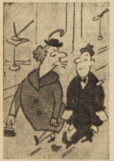
Kaj se širokousti! Vem, da mi ne boš kupil novega kloba.

POTRPLJENJE Zdravnik hodi po bolnišnici in vidi, kako neki bolnik vneta piše. »Ali pišete pismo?« vpraša. »Da,« odgovori bolnik in piše naprej. »Komu ga pa pišete, če smem vprašati?« »Sebi.« »O, to je pa zelo zanimivo. Kaj pa si pišete?« »Kako naj to vem? Pošta pri- de šele jutri.«