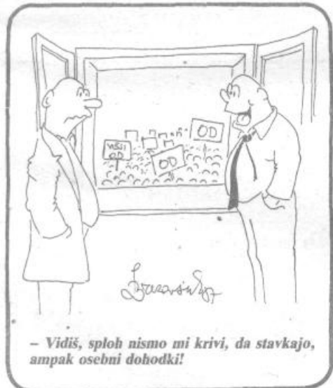
– Vidiš, sploh nismo mi krivi, da stavkajo, ampak osebni dohodki!