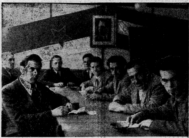
Predsedniki in zastopniki združenj na posvetu