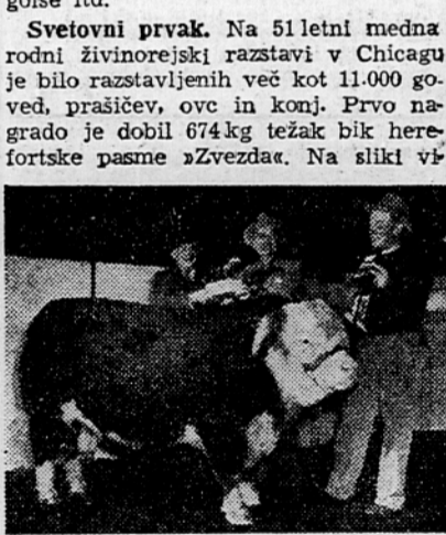
dimo »svetovnega prvaka« in od leve proti desni vrhovnega sodnika razstave, lastnika bika in hlapca.

Svetovni prvak. Na 51 letni mednarodni živinorejski razstavi v Chicagu je bilo razstavljenih več kot 11.000 goved, prašičev, ovc in konj. Prvo nagrado je dobil 674 kg težak bik herefordске pasme »Zvezda«. Na sliki vidiš dimo »svetovnega prvaka« in od leve proti desni vrhovnega sodnika razstave, lastnika bika in hlapca.