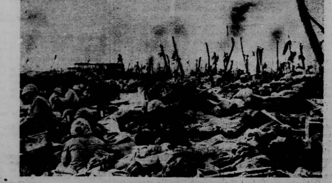
Na otoku Roi so ameriški vojaki razvili svojo zastavo na okleščenem drevesu. — Otok Roi se nahaja v Marshallovem otočju na srednjem Pacifiku.