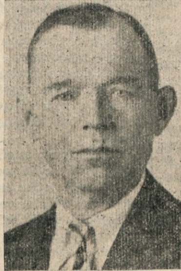
27. OBLETNICE SMRTI NAŠEGA SOPROGA IN OCETA